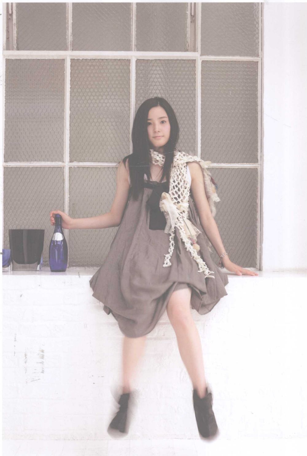
Canon EOS 5D Mark II / EF 50mm F1.2L USM / 光圈优先 1/6秒 F9.0 EV+0.3 ISO100 白平衡:自动 照片风格:标准

要发挥出高性能超级跑车的全部实力,需要驾驶员的精细操控。用5D Mark II摄影也有同样的感觉。正因为如此,当我们能很好地驾驭它时,也会让人感到分外快乐。