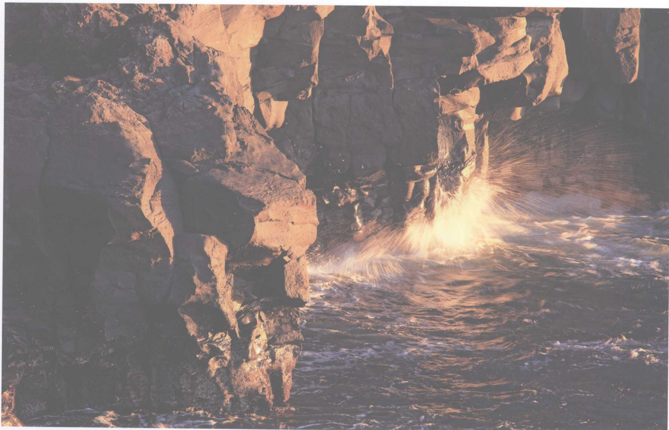
上图拍摄于静冈县城崎海岸。带着红色的朝阳照耀着礁石，照片捕捉到了浪涛拍岸时浪花四溅的瞬间。由于使用了高光色调优先功能，阳光照射下的波浪影调得到了完美保留，没有出现高光溢出现象。 Canon EOS 5D Mark II / EF 70-200mm F4L IS USM / 1/8秒 F16.0 ISO200 白平衡：日光