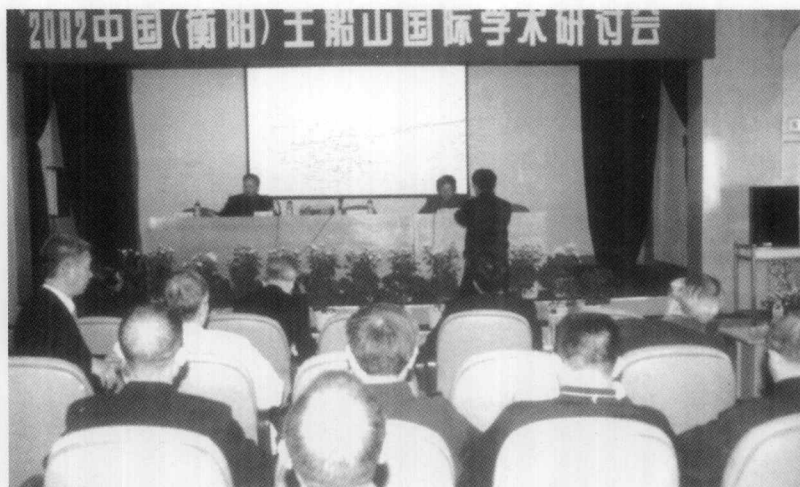
与会学者在南华大学开展学术交流