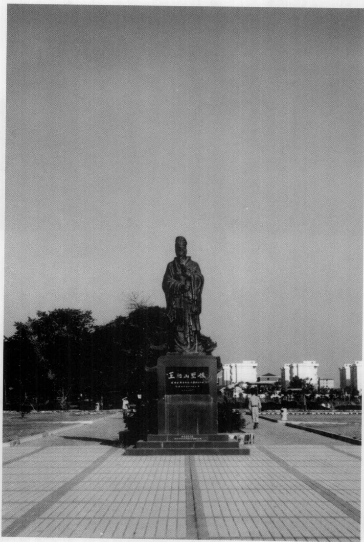
位于衡阳市高新开发区船山公园内的王船山铜像