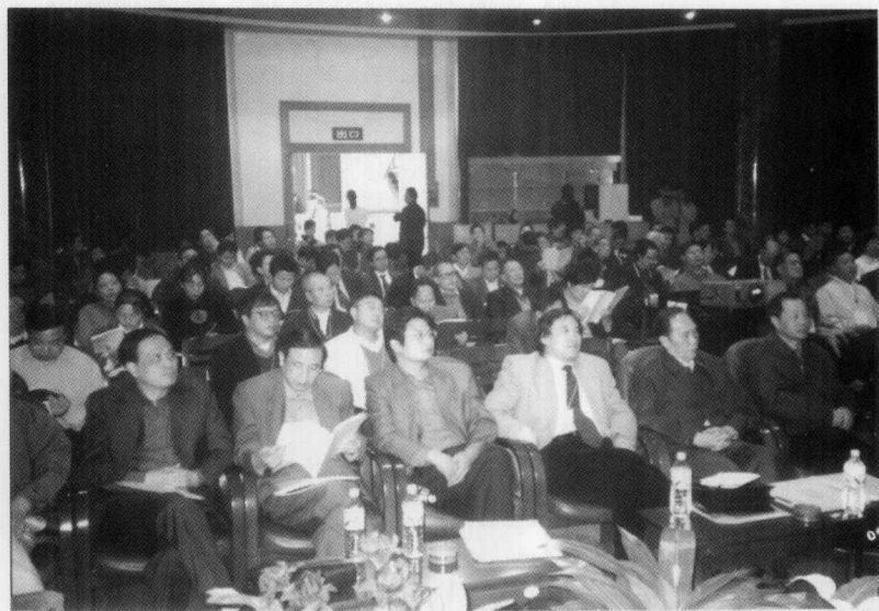
与会学者在衡阳师范学院开展学术交流