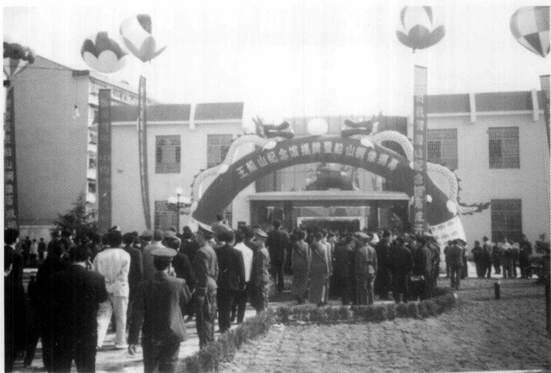
与会学者参观衡阳县船山广场旁的船山纪念馆