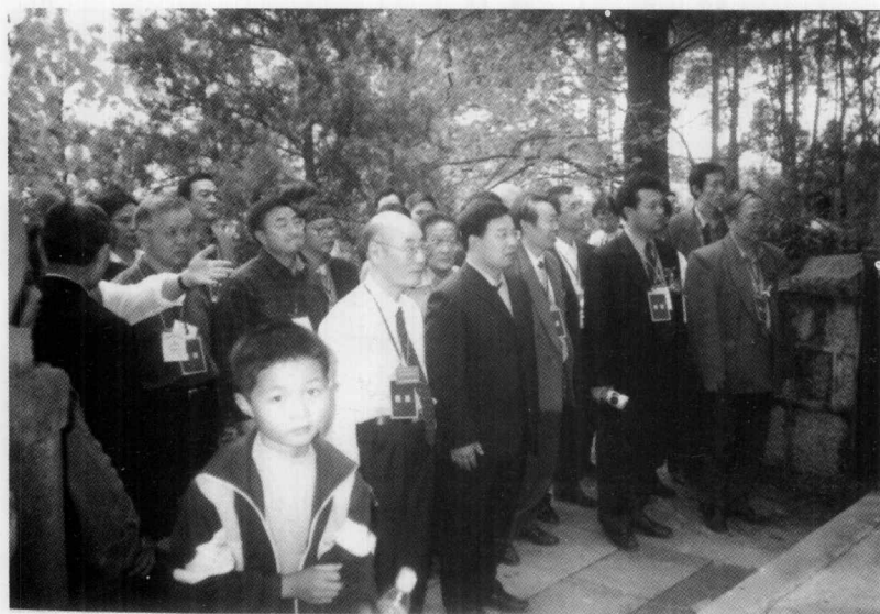
与会学者拜谒船山墓