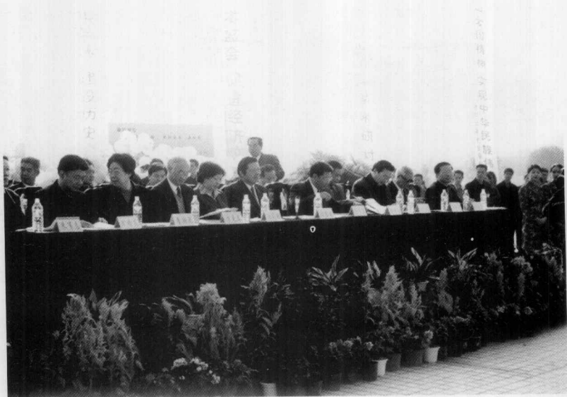
2002年中国（衡阳）王船山国际学术研讨会开幕式主席台