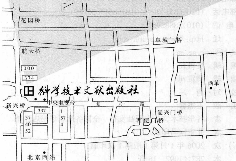
科学技术文献出版社方位示意图