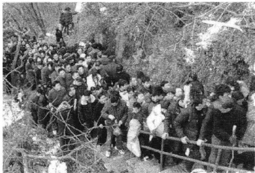
图2 正月初五前往灵顺寺迎财神的人群

就灵顺寺来说,尤其是每到新年(春节)期间,前来灵顺寺祈财的香客蜂拥前来,香火特别旺盛。相传每年正月初五是财神的生日,来自各地特别是江浙沪一带的善男信女,络绎不绝地前来灵顺寺进香许愿、迎请财神。每年的春季,是杭州地区所谓的“春香”季节,各地香客也是成群结队、络绎不绝地前来进香。其场面热闹非凡,有时甚至是十分壮观。