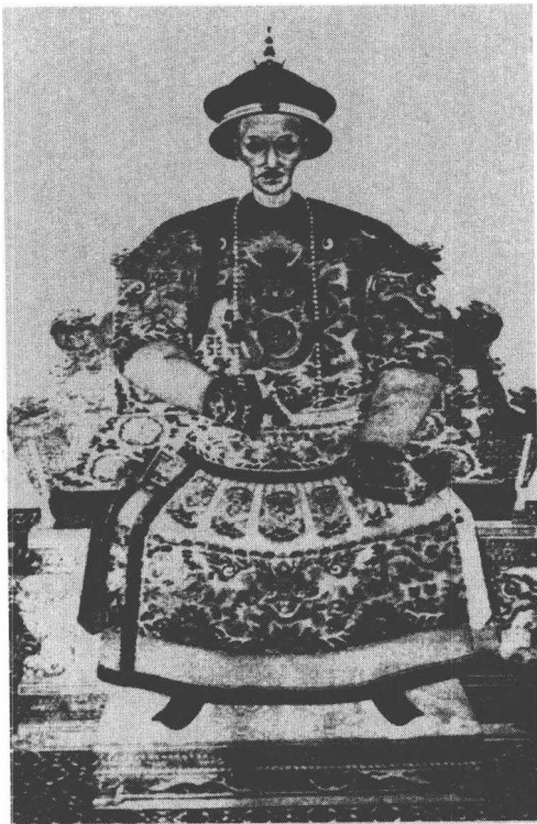
道光皇帝一生有子九人，有女十人，后来的咸丰帝奕訢为四子，恭王奕訢是六子。