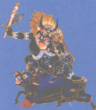
阎罗 掌管地狱、执掌 六道轮回的护法神