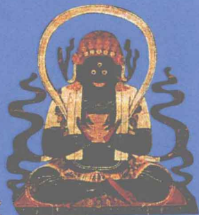
独髻母 能摧毁对佛教 有害的一切异端生命