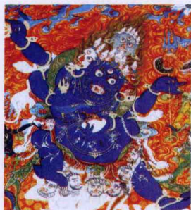
藏传佛教的首席护法——大黑天