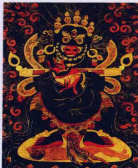
男性护法之首大黑天