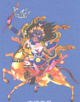
吉祥天母 能逢凶化吉的护法女神