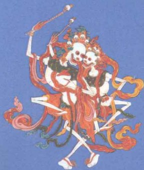
尸陀林主 能化解来自坟场的凶兆