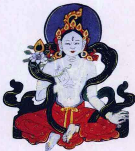
美丽慈祥的白拉姆