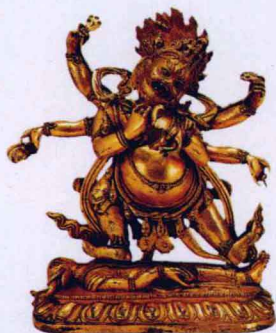
铜镀金六臂大黑天