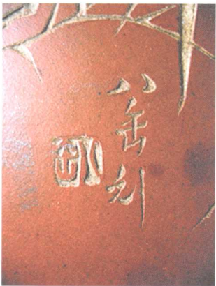
壶底款“宜兴蜀山陶业生产合作社出品”和托盘上的“八缶刻”款