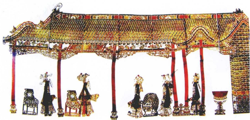
彩版六 冀东皮影《双挂印》场面造型