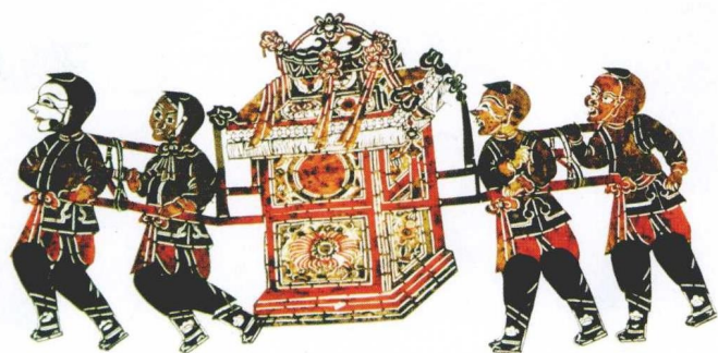
彩版七 童子抬轿造型