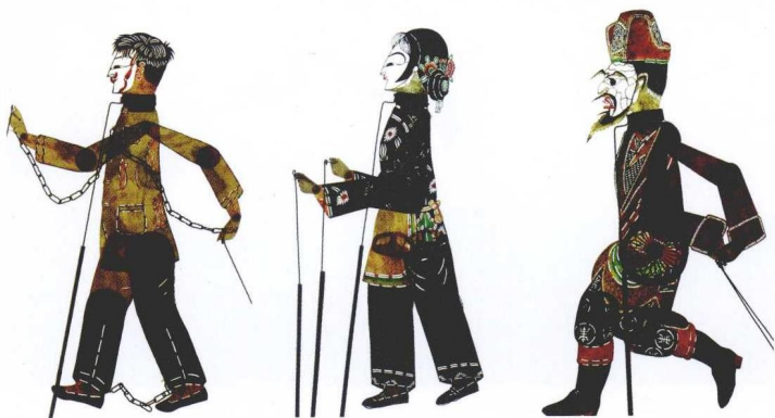
彩版三 秦皇岛皮影剧团演出的样板戏中的人物李玉和、阿庆嫂、座山雕