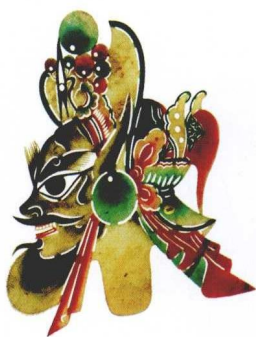
刘田增雕刻的张飞头茬