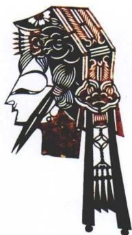
刘继成雕刻的道姑