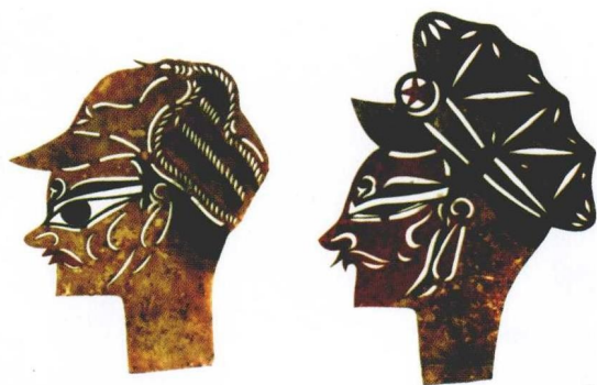
彩版一 影戏中的八路军红军造型