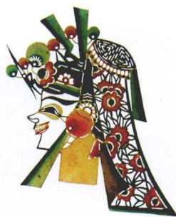
赵光恩雕刻的丑武生