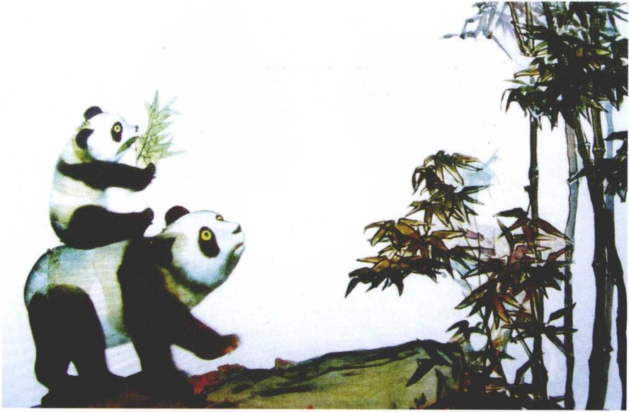
彩版四 唐山市皮影剧团演出的童话剧《熊猫咪咪》