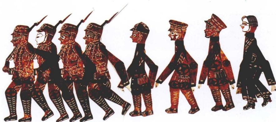
彩版二 新长城影社当年使用过的皮影造型