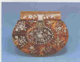
漂亮的皮手包, 饰有玳瑁壳碎片和珍珠, 使人们回忆起家具镶嵌工艺, 德国 1820 年制造。

综观整个世纪的发展变化, 手包毫无疑问地反映出女人的职业和愿望的变迁。一方面, 手包很具实用性, 另一方面, 它也让人们浮想联翩, 因为手包里面装满了女人们的梦想和秘密。很久以来, 当精神分析专家一直留意手包的象征意义的同时, 从《笨拙画报》(Punch Magazine)到奥斯卡·怀尔迪(Oscar Wilde), 漫画家和讽刺作家却以各自不同的方式, 不厌其烦地讽刺了这些不幸的手包。