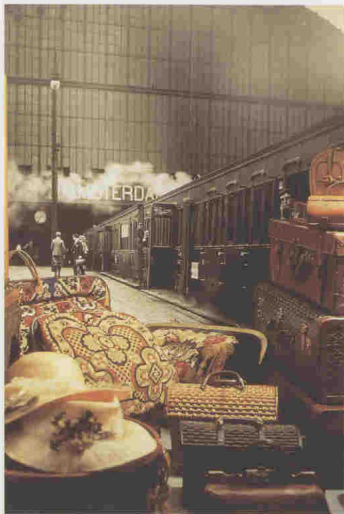
堆放在火车站月台上的 1850—1910 年期间制造的皮质平顶行李包(上图)。意大利萨尔瓦多·菲拉加莫 (Salvatore Ferragamo) 设计的白色肩包(右图), 具有坚固的环形金属搭扣和金属链背带。