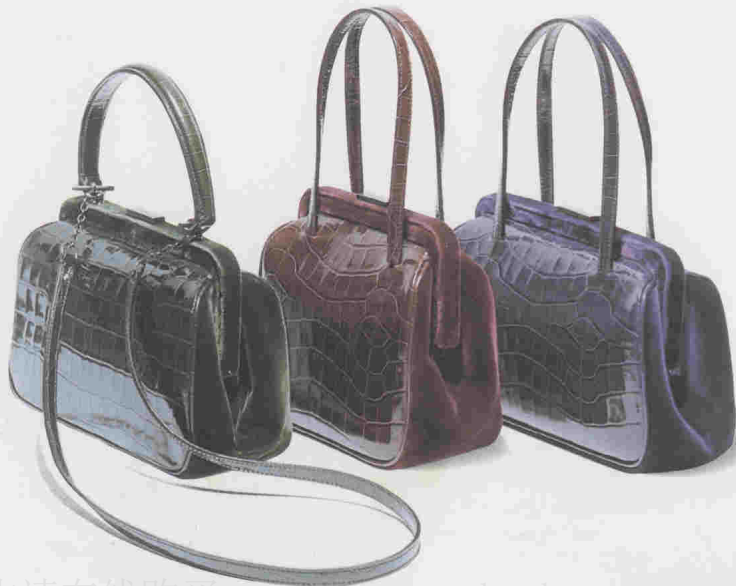
普拉达 (Prada) 公司在 1997—1998 年制造的闪光、带支撑框架的手包。