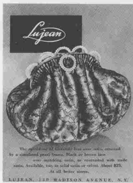
纽约的麦迪逊大街卢及恩 (Lujean) 品牌的 20 世纪 50 年代晚礼包, 是褶皱机制包, 黑色蕾丝收边, 包口是饰有人造珍珠的框架。