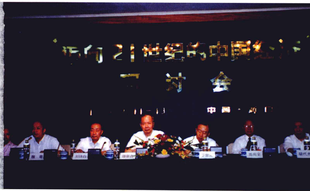
1995年9月在海口“迈向21世纪的中国经济”研讨会上