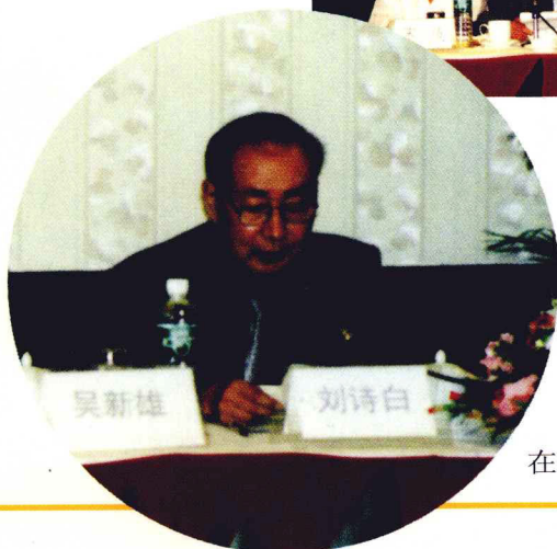
在研讨会上致开幕词