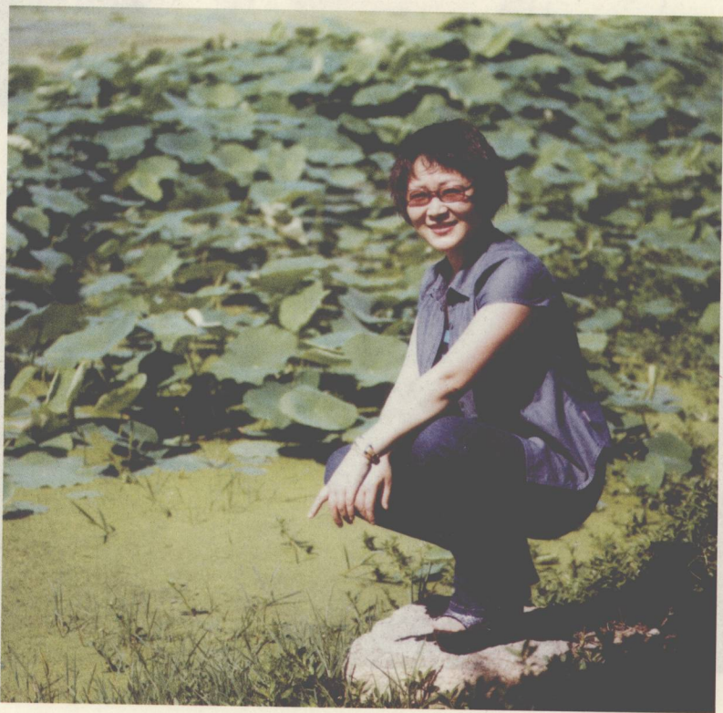
选择阳光明媚的生活，把美好的东西快快乐乐地传递给人们。

值得一提的是，《怀存看人》不管有意还是无意，应了一句老话：是真佛只谈家常。她笔下的这些文化人，不少是泰斗级人物，是国宝。他们说话绝没有半桶水名人那样拿腔拿调，故作深沉深刻状，而是说得很平常，看上去谁都能说出来的话。其实，从他们嘴里说出来，就算是一句家常话，内涵却不一样。例如写与贺敬之谈诗一节，看似平淡，其实很有意思。贺老先是希望张怀存的诗要“放开眼界，关注社会”，后来又说，“不要刻意追求写社会的诗，顺其自然吧，顺其自然才是真”。据我所知，贺敬之诗歌的美学精神最根本的一条就是讴歌时代，讴歌人民。为何告诉后辈诗人不要刻意追求写社会的诗呢。其实这是从张怀存创作实际出发的大实话。从中，我们感受到老一代人对当代诗歌的宽容与理解。当然，我以为，诗歌的生命还是在于和社会现实的紧密联系；阳光诗歌也是一种联系方式。我以为，