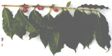
长在树上的咖啡豆