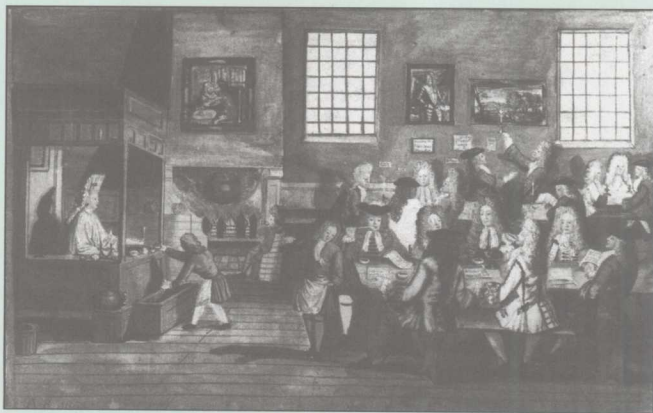
● 图中描绘了人们在伦敦的咖啡馆里谈论商业、科学、宗教的情景。

● 咖啡馆对启蒙思想的传播有什么作用？咖啡的消费和跨大西洋的奴隶贸易有什么联系？