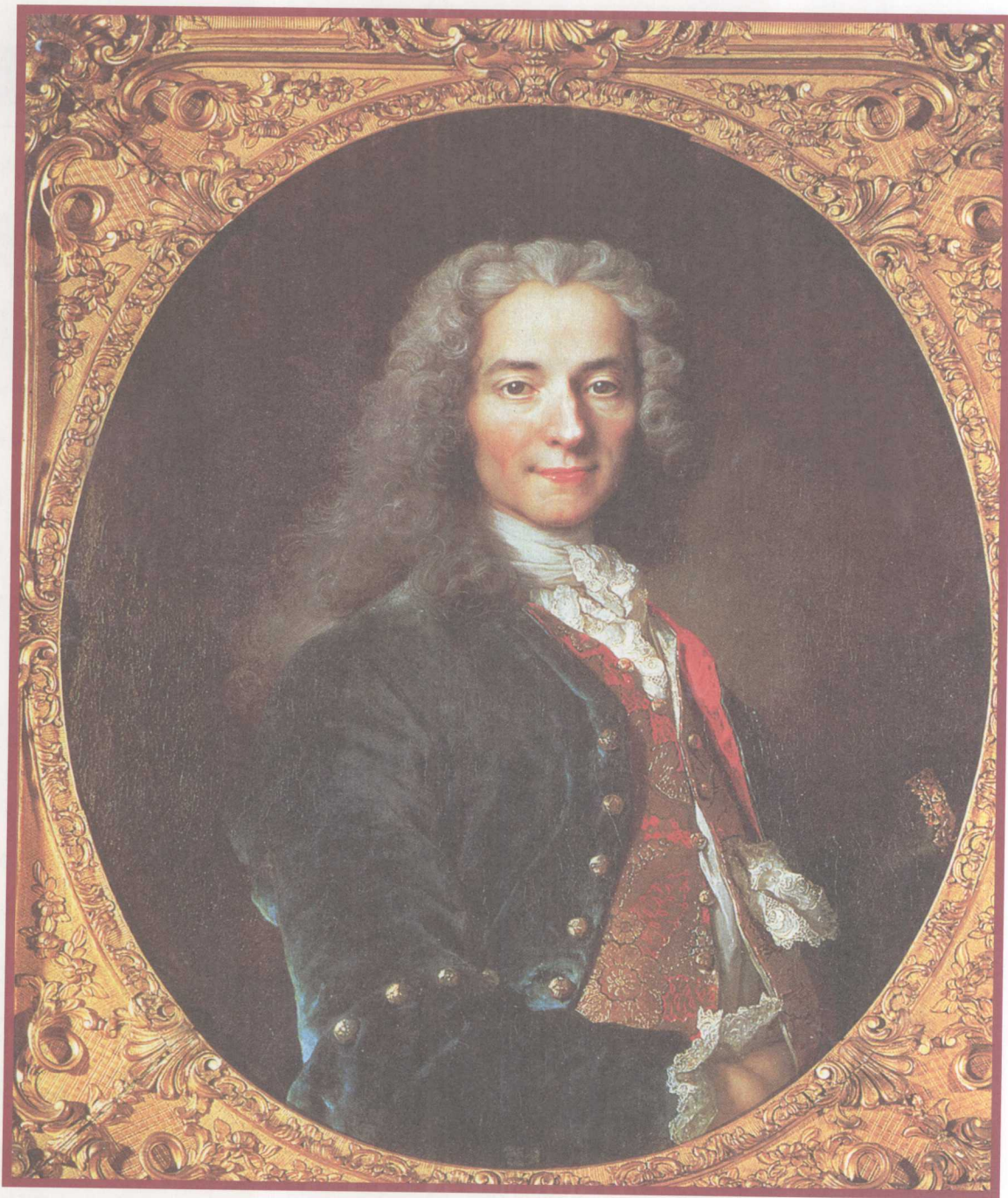
● 哲学家、戏剧家、诗人、历史学家以及科学思想的推广者伏尔泰（Voltaire，1694—1778年），是18世纪最负盛名、影响力最大的启蒙思想家。他尖锐的讽刺作品以及对宗教机构的批评，是日后人们批评欧洲的政治和社会现状的先声。Nicolas de Largillière在1728年绘制的23岁的伏尔泰的半身肖像。私人藏品。Musée de la Ville de Paris, Musée Carnavalet, Paris, France.