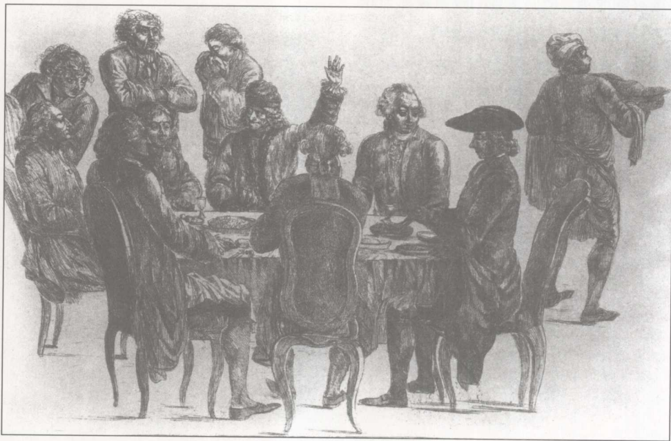
● 这幅版画描绘的是启蒙思想家参加的一次晚宴。正中间把手举起来的那位是伏尔泰。紧挨着伏尔泰右首坐的是狄德罗。

为了人类的自由而改革宗教、政治思想、社会、政府以及发展经济，是所有启蒙思想家的共同理想。如同彼得·盖 (Peter Gay) 所指出的，这个目标包括“权利自由，言