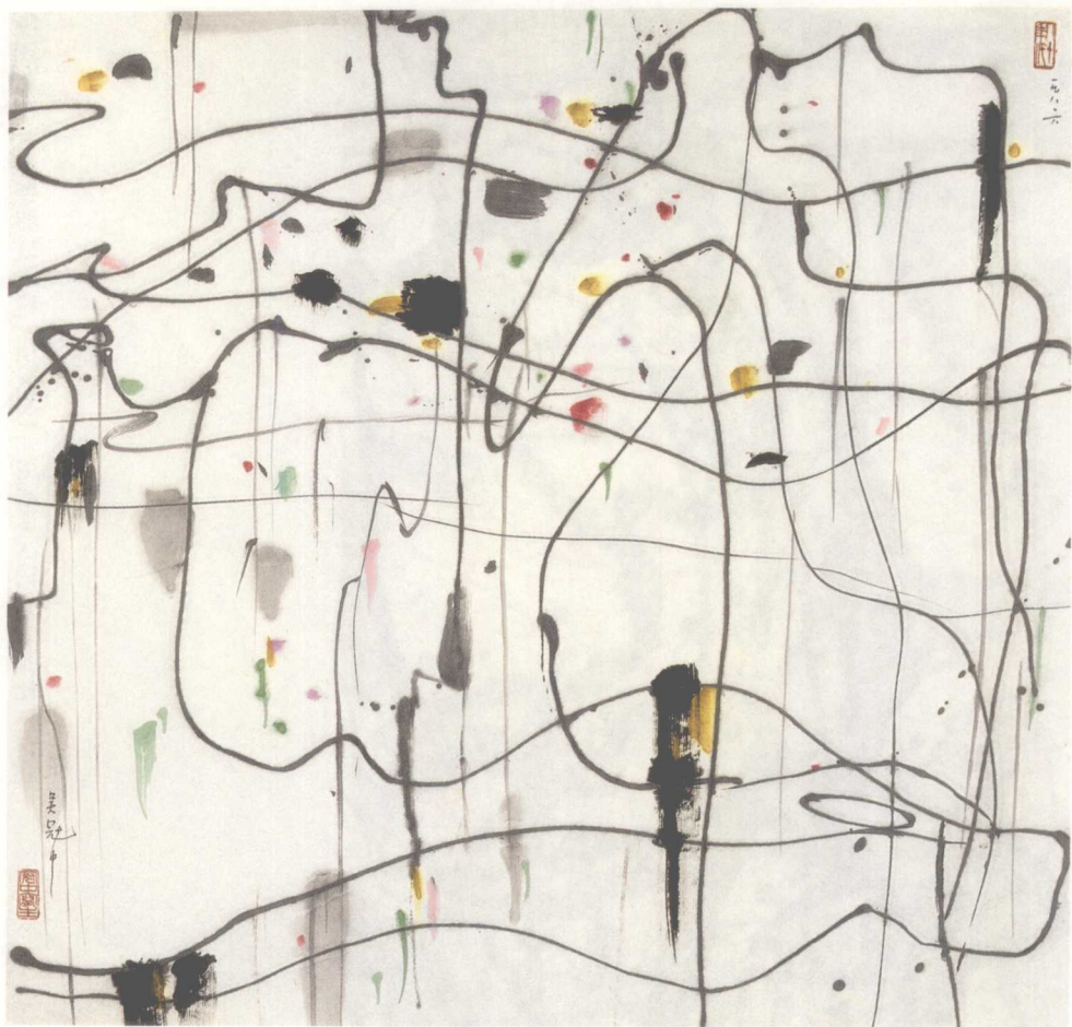
春曲（墨彩） 70×70cm 1986年