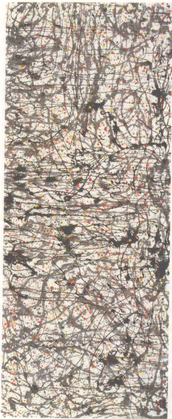
墙上秋色（墨彩） 145 × 368cm 1997年 上海美术馆藏