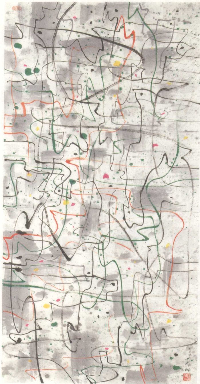
浮游（墨彩） 70×140cm 1995年 上海美术馆藏