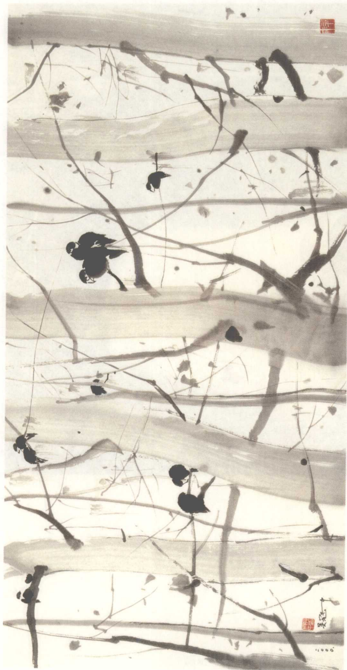
长日无风（墨彩） 70 x 140cm 2000年 上海美术馆藏