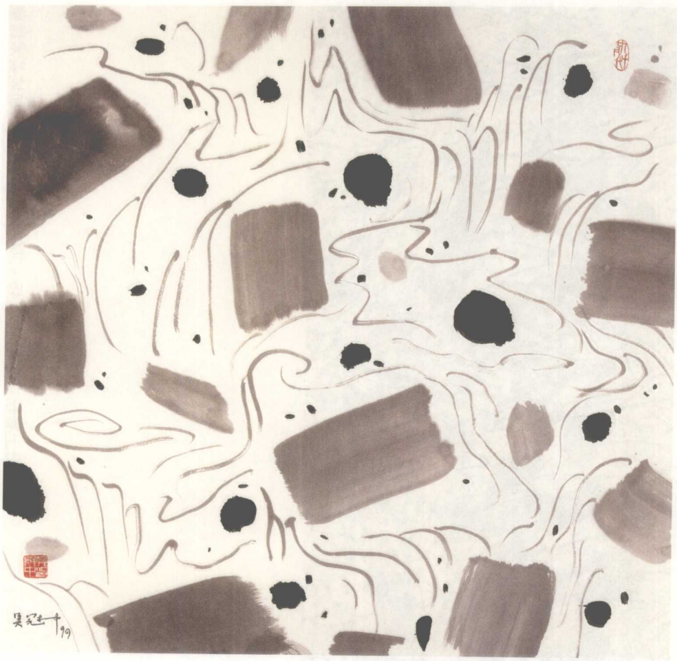
瀑（墨彩） 70×70cm 1999年 上海美术馆藏