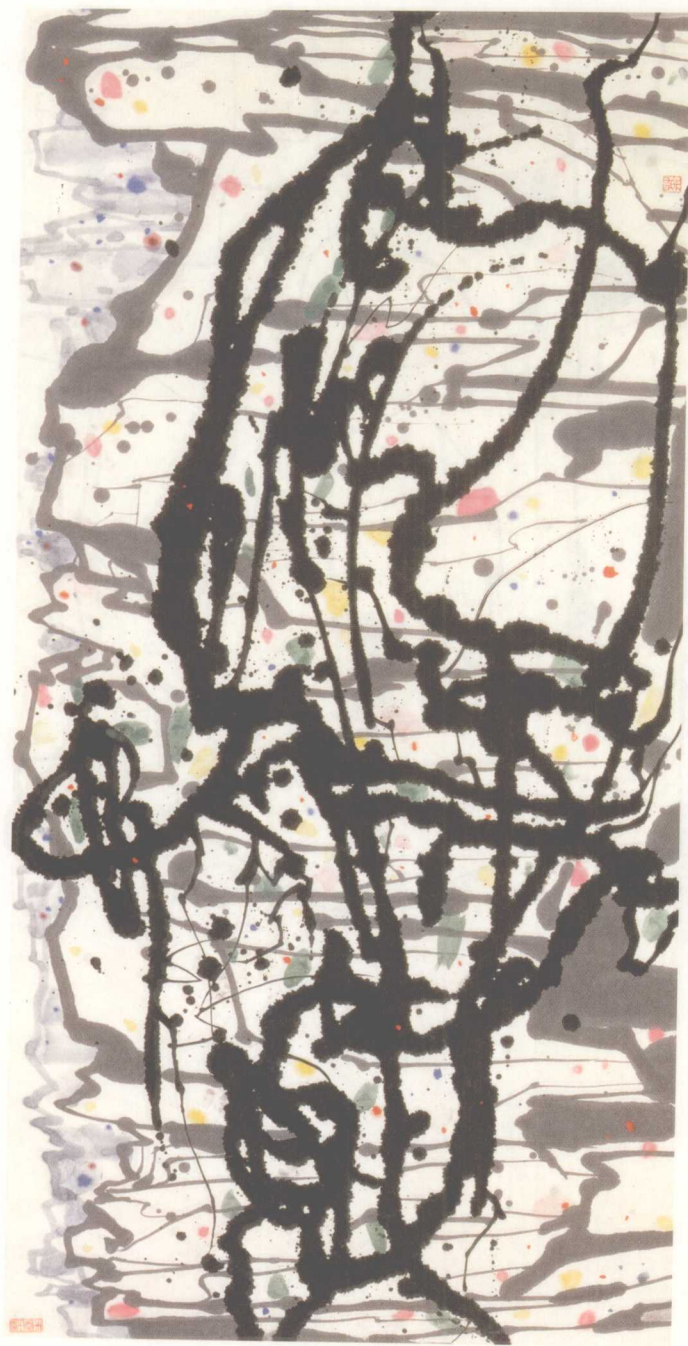
松魂（墨彩） 70×140cm 1984年 美国堪萨斯大学艺术馆藏