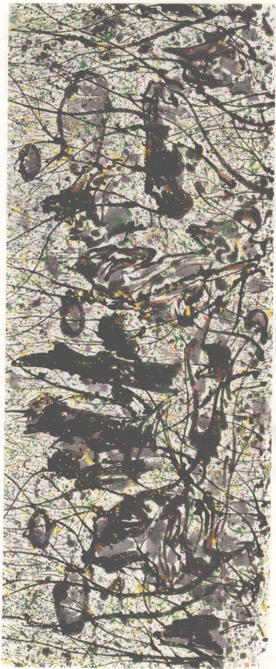
母土春秋（墨彩） 145 x 368cm 1997年 新加坡美术馆藏