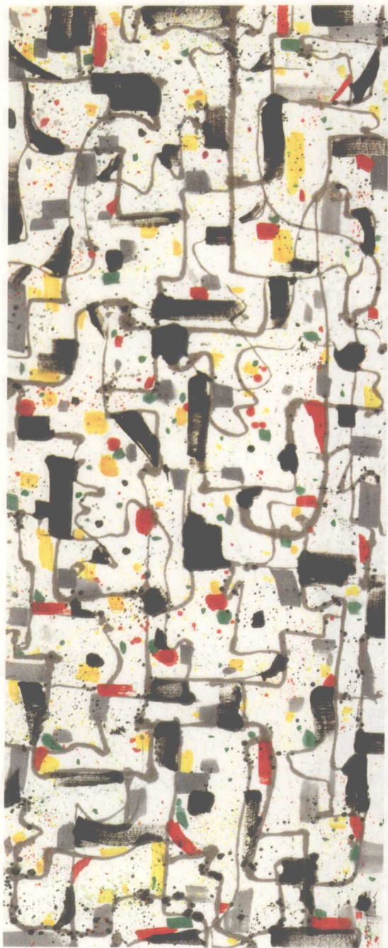
沧桑之变（墨彩） 145 × 368cm 1998年 上海美术馆藏