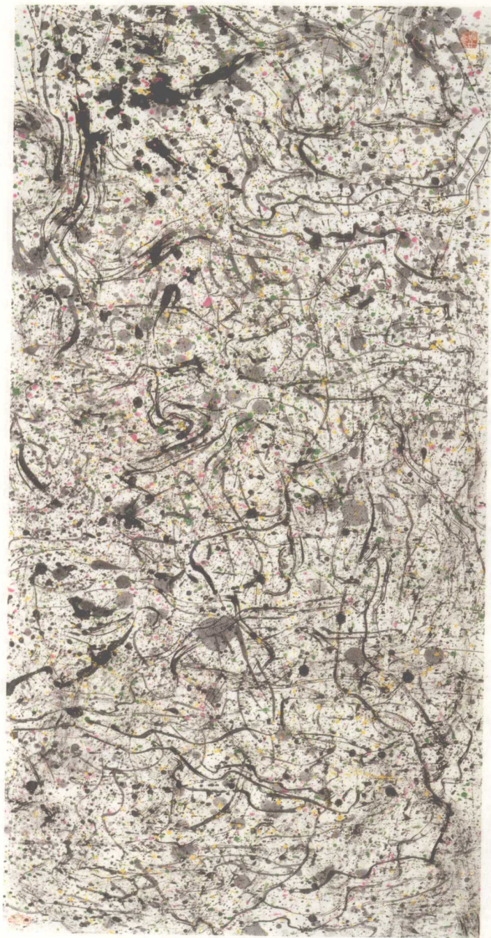
流迹（墨彩） 70 × 140cm 1997年