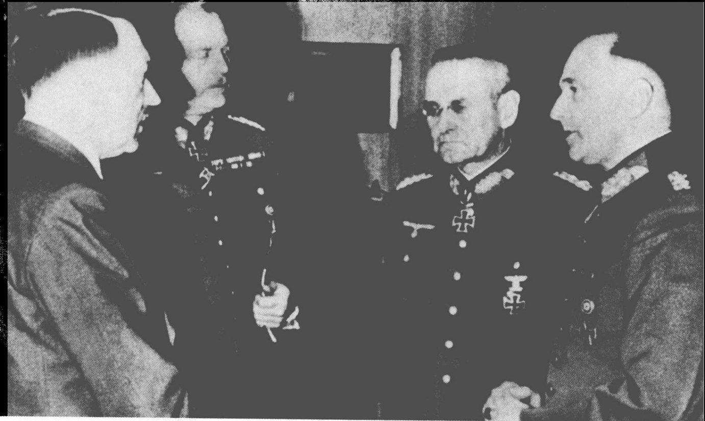
△ 希特勒与手下高级将领在一起研究“黄色方案”。