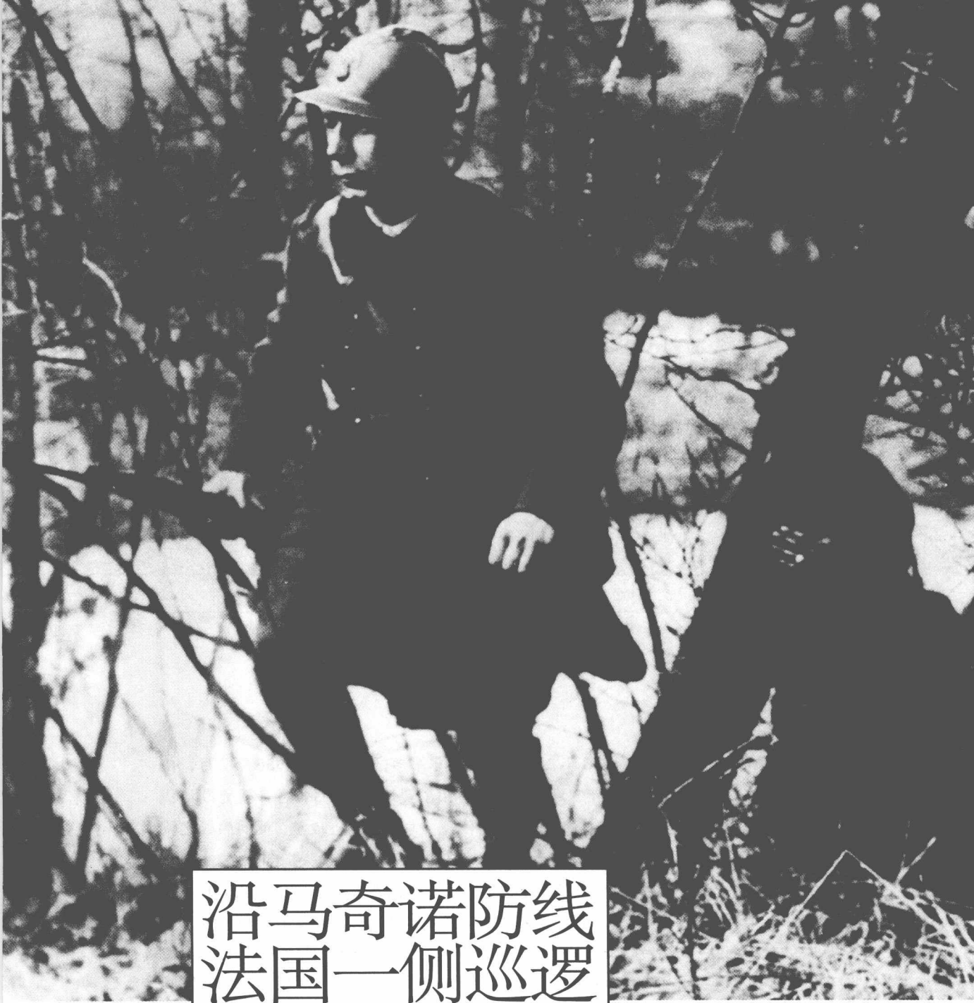
沿马奇诺防线 法国一侧巡逻 的法军士兵。