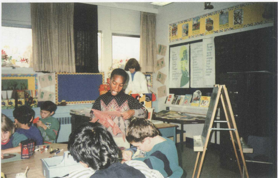
加拿大小学生在进行小组学习