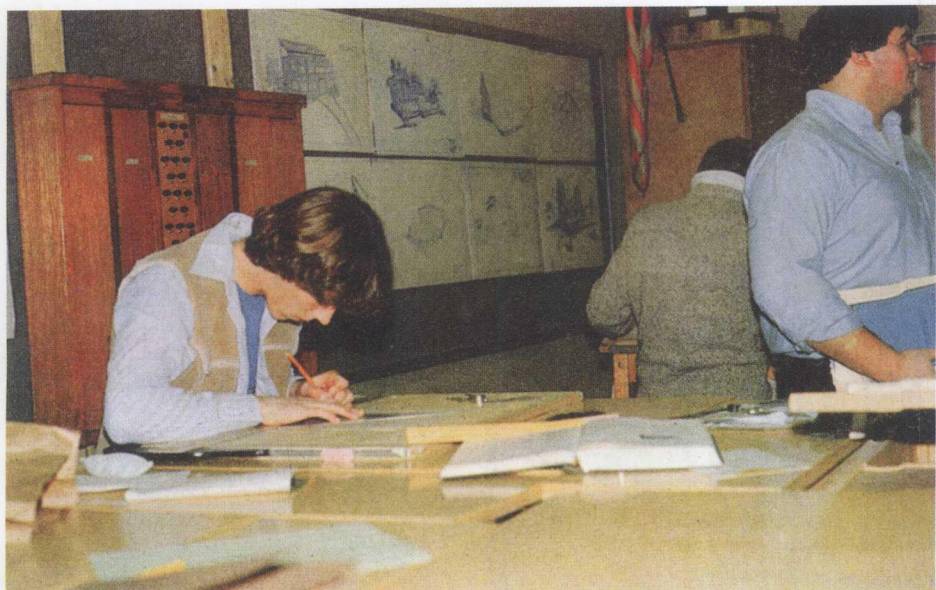
美国综合中学生计探索课程之一——建筑设计