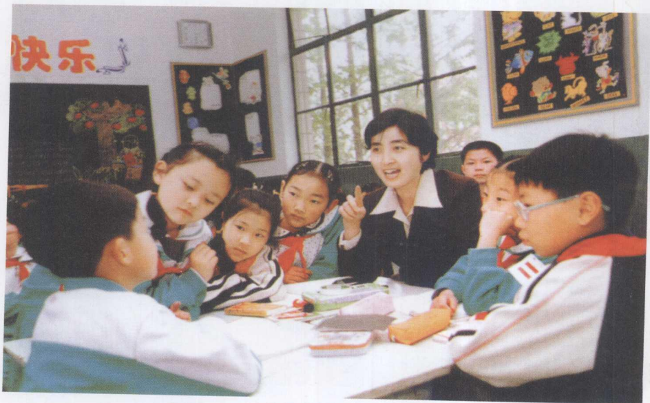
“新基础教育”改革在中国——“让课堂焕发出生命活力”