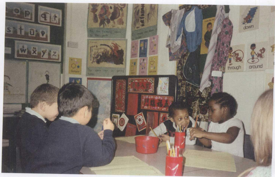
加拿大小学的多元文化教育