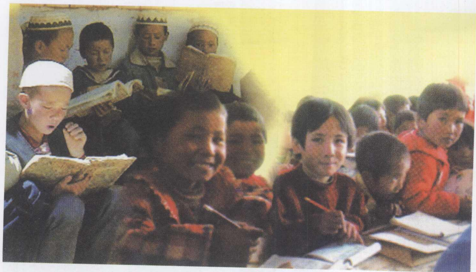
中国少数民族儿童和女童的学校教育受到政府和人民的高度重视