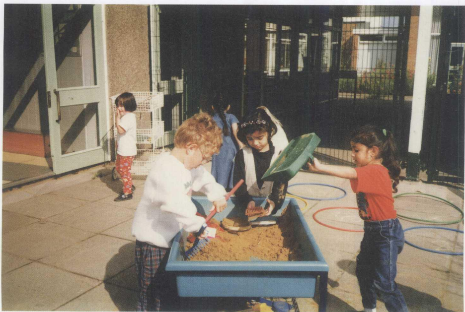
英国小学生在游戏中学习