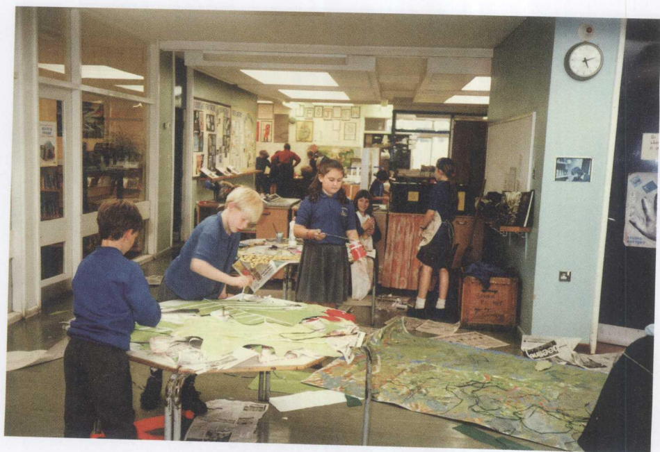
英国小学生在进行主题单元学习活动