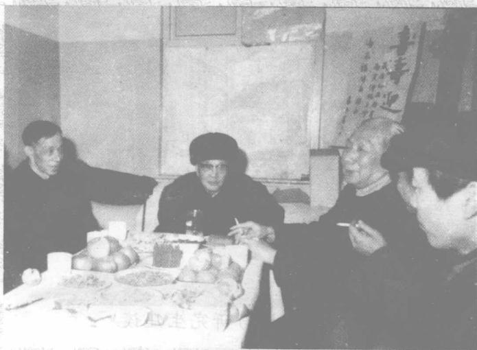
危北海教授召开北京中医医院座谈会