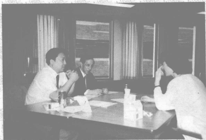
危北海教授与研究生座谈