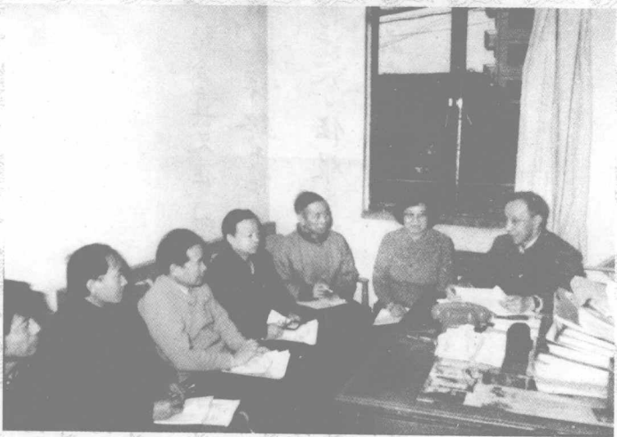
危北海教授在北京市中医研究所为学生讲座