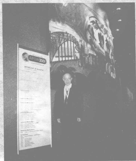
危北海教授参加中国中西医结合消化疾病学术会议