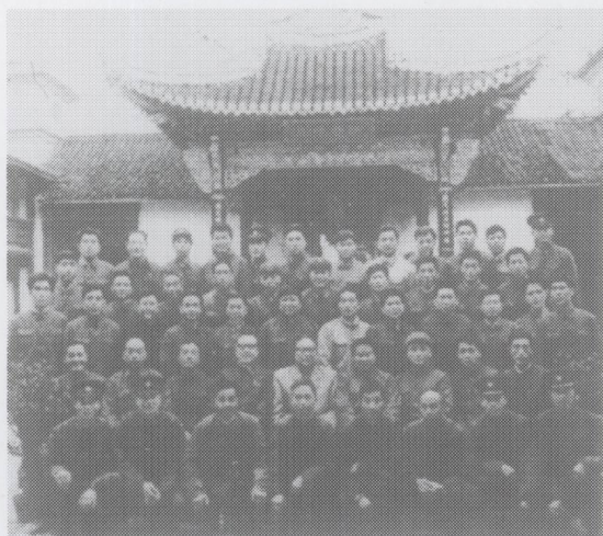
1978年5月，公安部副部长于桑（第二排左五）第二次到枫桥考察时留影。