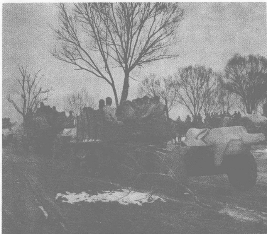
人民解放军炮兵部队开赴前线。