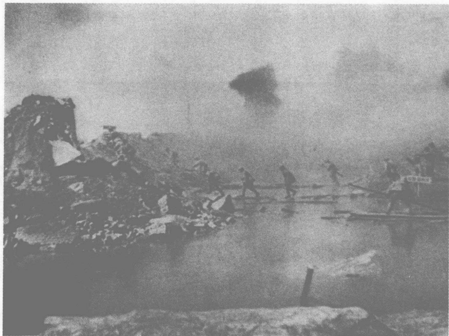
人民解放军以密集炮火摧毁国民党守军碉堡后，大批后续部队通过浮桥，向前冲击。