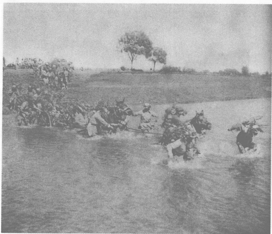
一支人民解放军部队正在开进。