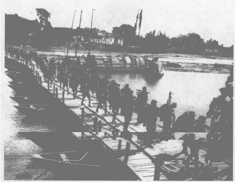
人民解放军通过唐江，向广东挺进。