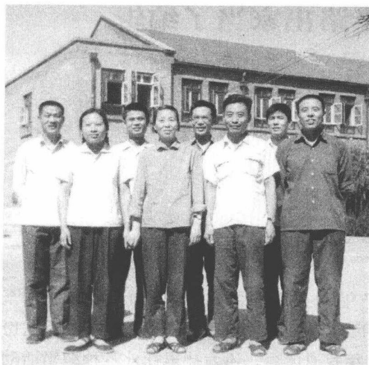
我与北京市机械局党校同事合影(1977年)

一所普通中学宽敞，也有点吃惊。没想到，出版过许多优秀著作的中青年人，就在如此简朴的环境中工作。