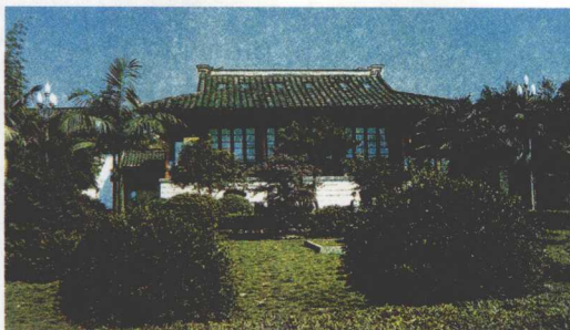
林则徐读书处(福州“宛在堂”)

嘉庆二十五年(1820)初，林则徐受命江南道监察御史。当他听到下属禀报河工员弁中各种营私舞弊、大搞垛料投机之事，不禁勃然变色，当晚便带领随员直奔仪封(今河南兰考东)查巡。发现有些人大搞垛料投机，哄抬料价，致使民工停工待料，他即奏准朝廷交料物按平价购买，杜绝中间盘剥。一时间，工地上下，料垛为之一新，仪封险工也迅速得以修复。大小官员，无不称颂林则徐督察认真，