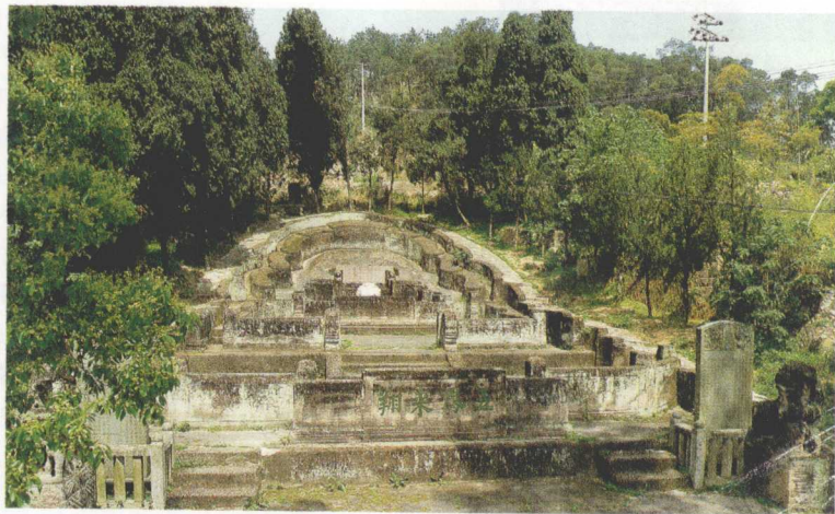
林则徐之墓（建于清代）

荒地的初垦，但因水源不足而废置。这次筹划重垦，他运用自己在内地长期治河的经验，计划开渠引进哈什河水。道光二十四年九月（1844年10月），林则徐与当地官员、绅民共同捐资，修建了大型引水工程，将哈什河水引至阿齐乌苏，自龙口至渠尾“无不盈科递进，水到渠成”。可灌溉田地十余万亩。到今天，这条宽阔的渠道碧波粼粼，仍滋润着西部土地，当地人民称之为“林公渠”。坎儿井是维吾尔族人民创造的地下水利设施，林则徐认为这是在高温少雨、气候干燥、蒸发强烈的地区理想的节水灌溉工程，所以大力推广。林则徐以带“罪”之身，遣戍新疆三年，为开发西部作出了贡献。