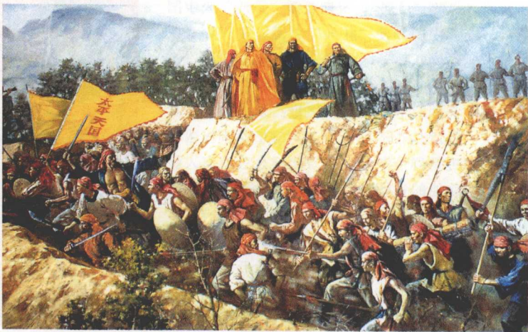
洪秀全纪念馆壁画

在短暂的胜利面前，洪秀全贪图享乐、缺乏远见的农民狭隘性暴露出来。因他不善处理领导集团内部矛盾，遂酿成天京内讧，杨秀清、韦昌辉被杀，石达开率十多万精兵出走，形势急遽逆转。1858年，洪秀全选拔、重用陈玉成、李秀成等年轻将领主持军事，又任用族弟洪仁玕主持政务，军心复振，再破江北营，获三河大捷。但整个局势并没有得到根本扭转。洪秀全缺乏积极的防御措施，滥封王爵，深居宫中，迷信天父，丧失了正确处理军政事务的能力，终至形势日恶，朝内、军内矛盾重重，败象毕露。在太平军的根据地接连丧失、天京被清军团团包围的情况下，他仍信天不信人，拒绝李秀成“让城别走”的建议，困守孤城。同治三年四月二十九（1864年6月3日）病逝。同年7月19日天京陷落，太平天国起义失败。洪秀全从一个村塾师走上武装斗争道路，领导了规模空前的太平天国革命，不愧为创造英雄史诗的“反清第一人”。洪秀全的一生，是一部英雄的史诗，又是一幕历史的悲剧。