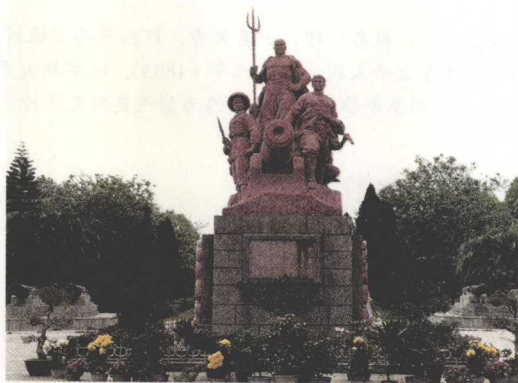
虎门镇林则徐公园抗英勇士群塑像

道光二十年（1840）五月底，英国侵略军发动了对华的侵略战争。由于林则徐在广东采取了严密的防范措施，迫使英船不敢轻易进攻广东，转而北上。道光皇帝认为英军挑衅是林则徐惹的祸，将林则徐革职查办，充军伊犁。林则徐壮志未酬，悲愤之中挥泪而去。58岁的林则徐把自己比作“荷戈西戍之老兵”，要在荒凉的西北边陲贡献自己的毕生，抱着“心安亦可成家”的信念，研读新疆历史地理，了解清代在新疆屯田备边的情况。道光二十三年（1843）冬，林则徐开始了阿齐乌苏