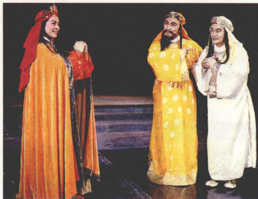
《天国春秋》剧照 中央戏剧学院话剧艺术实验室演出 (编剧阳翰笙, 导演何之安、金乃千)