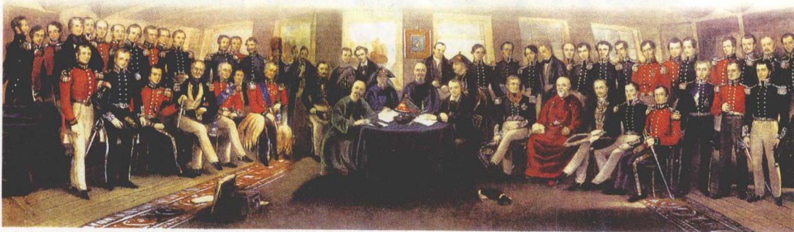
1842年，英军兵临南京城下，以中国被迫签订丧权辱国的《南京条约》而告终

就不能下跪。林则徐刚到广州时，也称茶叶、大黄是“制夷之大权”，相信夷人膝盖伸展不便。但林则徐与外部世界接触后，便改变了这种对西方无知的成见，首次提出向西方学习的重大课题，成为“开眼看世界的第一人”。他派人专门收集澳门出版的外国人办的报纸书刊，并把出身低下却懂英文者招入钦差行辕，让他们做翻译工作。林则徐夜夜仔细阅读、研究译文资料，并把译成中文的《澳门月报》编辑为《论中国》、《论茶叶》、《论禁烟》、《论用兵》、《论各国夷情》五辑。为了更多地了解外国情况，林则徐还利用机会直接同外国人接触，了解英国的海军情况及汽船情况。他组织翻译了1836年伦敦出版、英国人慕瑞所著的《世界地理大全》，命名为《四洲志》，成为近代中国第一部系统介绍世界自然地理、社会历史状况的译著。道光二十一年（1841），林则徐被流放途经扬州时，便把《四洲志》等有关