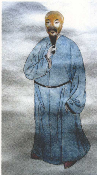
林则徐画像

极严，对草率所致质量低劣的工程负有责任的督工严加训斥，就地革职，并限令戴罪立功，返工重来。清代河工向以秸料为主，而秸料本身容易腐烂，需年年拆旧换新，耗资巨大。林则徐亲自考察抛石后的实效，得出了“碎石之于河工有益”的结论，大力推广抛石新技术。这是晚清河防工程的一大进步。林则徐认为只有兴修水利，才能提高抗灾能力，保证早涝有资。他在江苏巡抚任内大办水利的功绩曾受到人们的一致称赞。