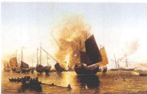
穿鼻海战中遭英军舰炮击而燃烧的中国帆船式兵船（油画）

林则徐禁烟前，国人对外部世界茫然无知，认为英国人吃的是牛羊肉磨成的粉，食之不化，离开中国的茶叶、大黄就会“大便不通而死”。清朝官员也称英国人膝盖不能打弯，所以拜见中国“万岁”