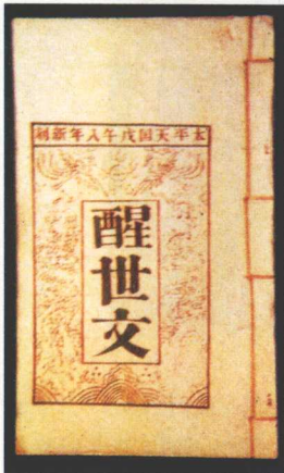
《醒世文》——太平天国时期的文献