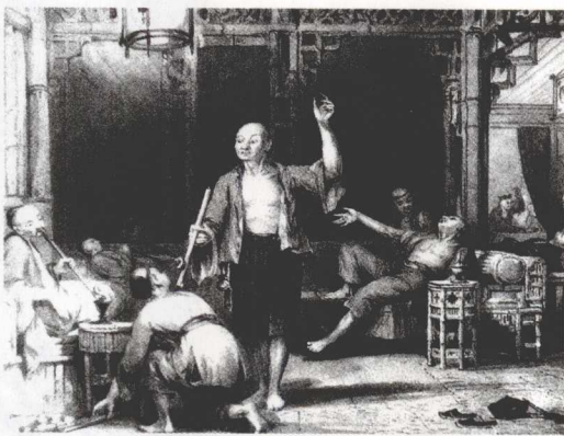
鸦片大量流入广州等地，甚至出现了专门供吸食鸦片的烟馆

政纪严明。连皇帝也赞扬他：“向来河工查验料垛，从未有如此认真者。”由于政绩卓著，治水有方，道光十一年(1831)林则徐升任东河河道总督，专管河南、山东的黄河、运河河务。他对工程质量要求