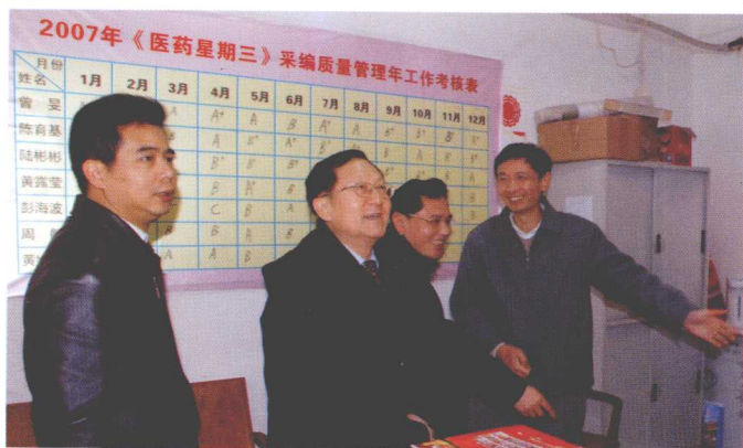
2008年1月，洪昭光教授到南方科技报社视察指导工作。