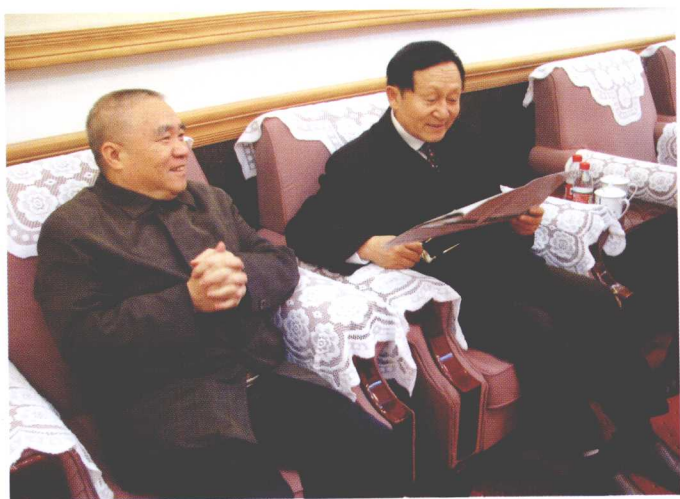
洪昭光教授（右）与广西区科协主席、中国工程院院士郑皆连亲切交谈。