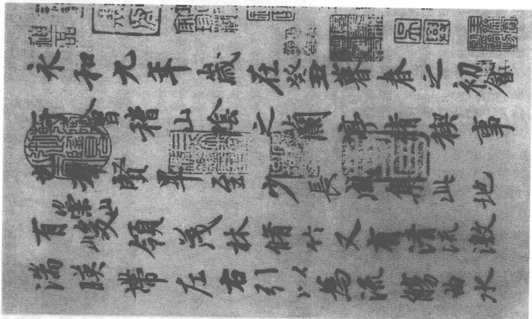
兰亭序帖 唐摹晋·王羲之