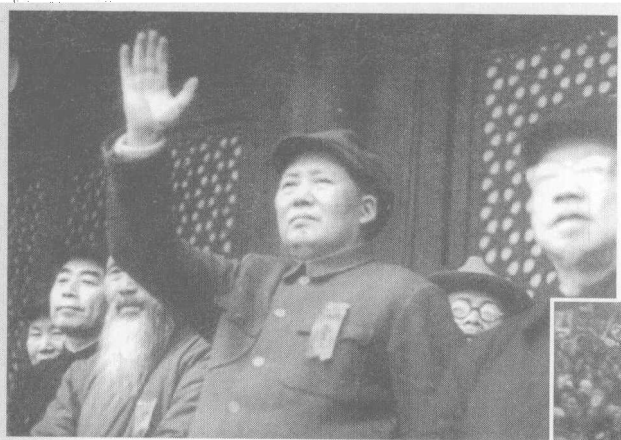
> 毛主席向群众挥手致意