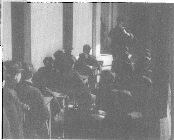
> 组织游民室内学习

宝荣。登记中,根据不同的对象做不同处理。给他们以劳动与改造的机会,使他们成为有用的人。政府还派出大批干部为他们工作,向他们说明政府收容的本意。这是上海市历史上所没有过的,也是在帝国主义和反动统治下绝不能办到的一件大事。这群可怜的人,如今他们都得到了救济,在政府和各界人民的努力帮助下,使他们都得到了温暖的生活,从此他们可以安心地学习,改造自己,参加生产,使自己成为建设新中国的一份力量。