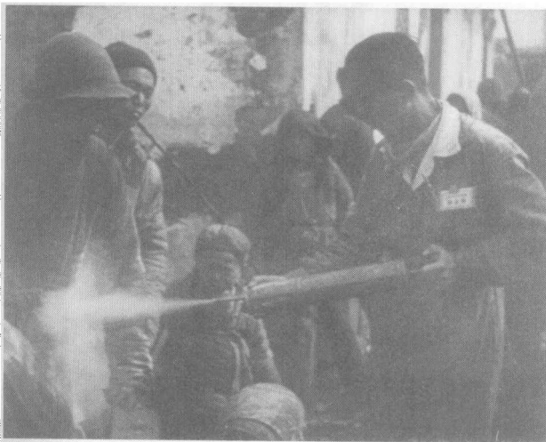
> 往乞丐身上喷洒毒气