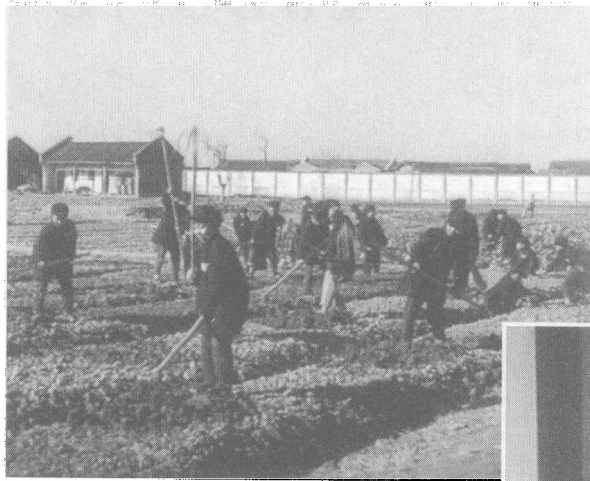
> 组织游民田间耕地