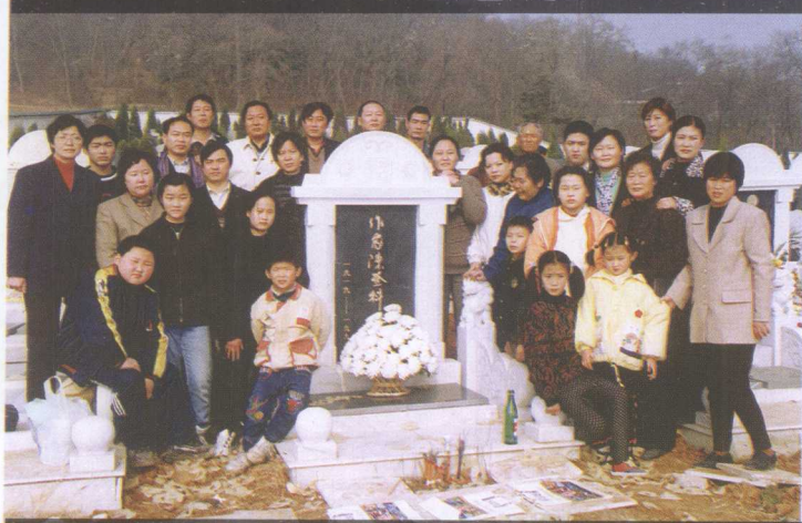
1998年12月22日，全家送别亲人