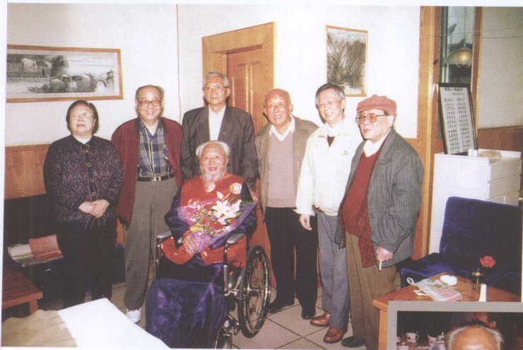
1998年元月一日，登科夫妻在深圳“青青世界”沐浴新年第一缕阳光