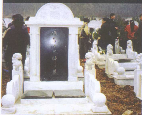
1998年12月22日，于合肥小蜀山烈士公墓，最后的归宿