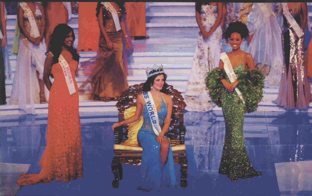
左起依次是：第二名获得者多米尼加小姐、冠军秘鲁小姐、 第三名获得者美国小姐。