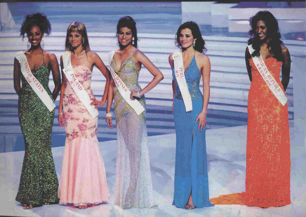
进入最后角逐的前五名 左起依次是：美国小姐、波兰小姐、 菲律宾小姐、秘鲁小姐、多米尼加小姐。