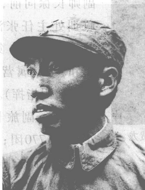
八路军副参谋长左权。