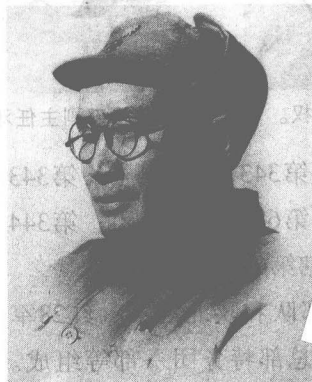
八路军第129师师长刘伯承。

应，副主任甘泗淇，辖第358、第359旅以及教导团和5个直属营。第358旅，旅长张宗逊，副旅长李井泉，辖第715、第716团；第359旅，旅长陈伯钧，副旅长王震，辖第717、第718团。