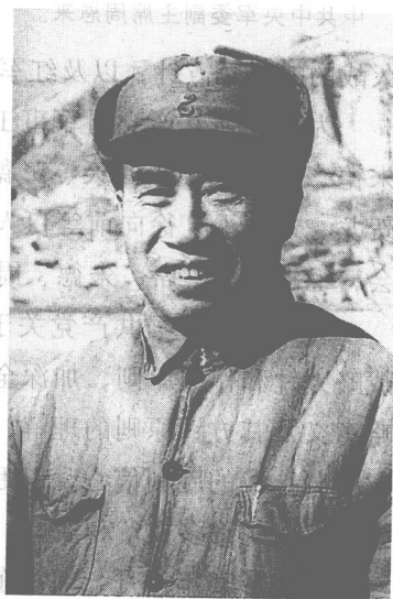
洛川会议组成了新的中共中央军委。这是中共中央军委主席毛泽东。