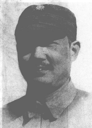
八路军参谋长叶剑英。