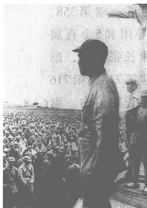
八路军总指挥朱德。