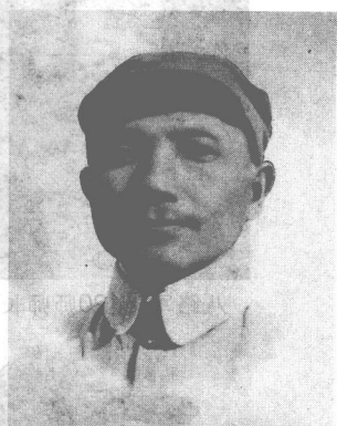
八路军政治部副主任邓小平。

训处主任罗荣桓，副主任萧华，辖第343、第344旅。第343旅，旅长陈光，副旅长周建屏，辖第685、第686团；第344旅，旅长徐海东，副旅长黄克诚，辖第687、第688团。