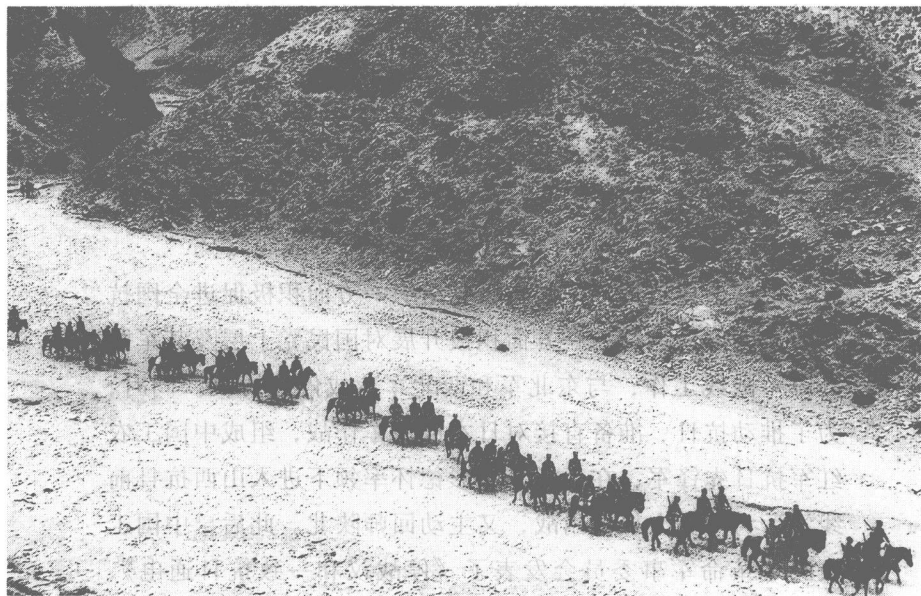
八路军开赴抗日前线。

“平津危急！华北危急！中华民族危急！”日本帝国主义于1937年7月发动了全面侵华战争，中华民族到了最危险的时刻。为了收复被占领的国土，为了拯救受难的广大同胞，