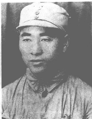
八路军第115师师长林彪。