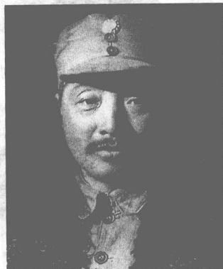
八路军第120师师长贺龙。