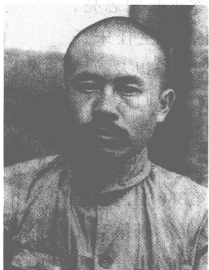
八路军政治部主任任弼时。