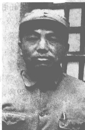
八路军副总指挥彭德怀。