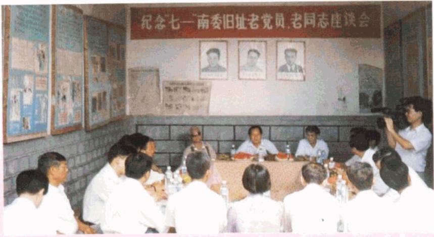
县委、县政府重视抓好精神文明建设工作。图为县委领导出席纪念“七一”老党员老同志座谈会