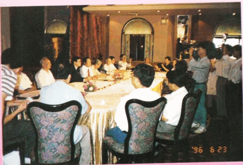
县委、县府在广州召开茶文化座谈会