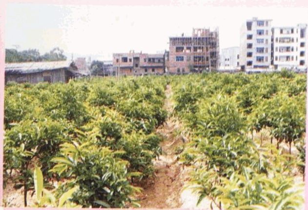
全县苦丁茶园面积 525.3 公顷。 图为苦丁茶基地一角