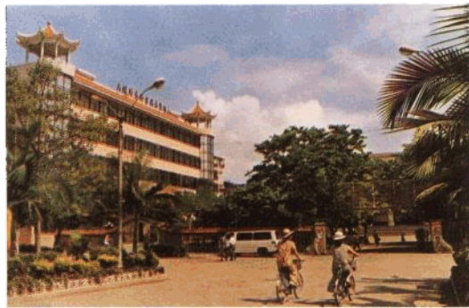
环境优美的县城府前路