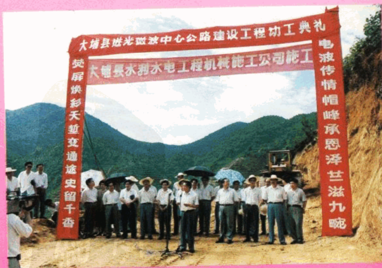
县进光微波中心公路建设工程动工典礼