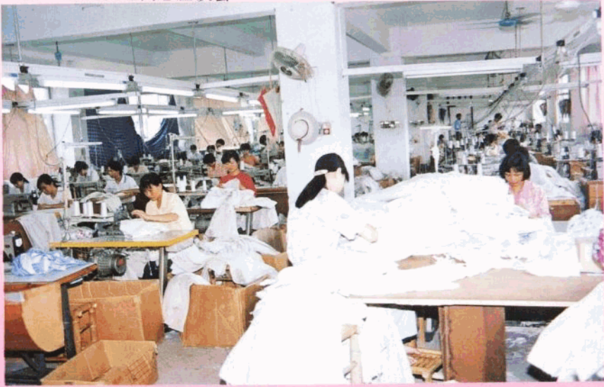
全县有“三资”企业 126 家，合同投资总额 6.6 亿元，实际利用外资 2834 万美元。图为“三资”企业的制衣车间。