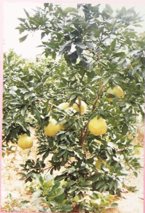
全县蜜柚园面积 2412.9 公顷，投产 面积 1666.7 公顷，总产 2.6 万吨。