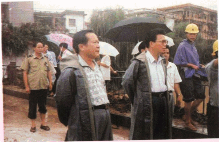
市委书记谢强华、县委书记曾百友等领导深入重灾区指挥抗洪救灾