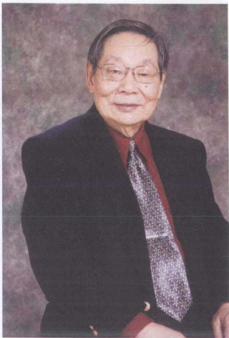
作者像(摄于2007年1月29日)

王尔敏(1927—),原籍河南省周口市。我国当代著名历史学家,台湾中国近代史研究的重要代表人物之一。毕业于台湾师范大学史地系。历任台北中研院研究员,香港中文大学、台湾师范大学教授。研究领域包括中国近代思想史、军事史、外交史、文化史以及方志学等。著有《史学方法》、《淮军志》、《清季兵工业的兴起》、《中国近代思想史论》、《晚清商约外交》、《晚清政治思想史论》、《清季军事史论集》、《上海格致院志略》、《明清时代庶民文化生活》、《明清社会文化生态》等。