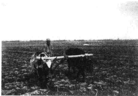
骑马跨越亚洲的真实记录——代前言 (马大正)