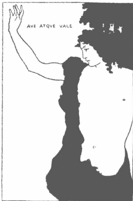
● Beardsley 所作画 （参阅本卷 25·118 《伤逝》 及 26·055 《“挥手郎图”》）