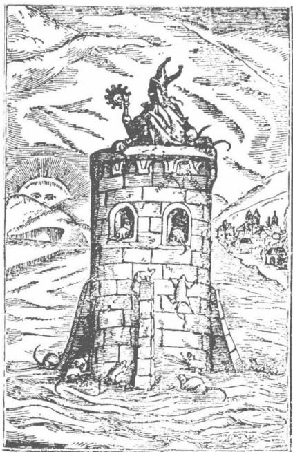
● 塔上的哈多主教 （《十字街头的塔》原插图， 参阅本卷 25·030）