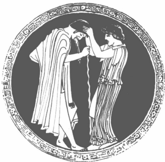
● 《陀螺图》与《醉酒图》 （《希腊陶器画两幅说明》原插图， 参阅本卷 25·012）