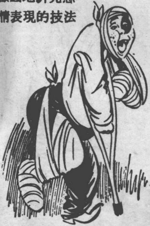
人體各部漫畫化的实例和姿態漫畫的表現法