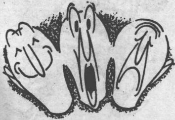
徹底地研究感情表現的技法