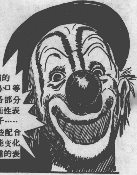
100種的眼、鼻、口等臉上各部分的漫畫性表現例子……把這些配合，則能變化出各種的表情。