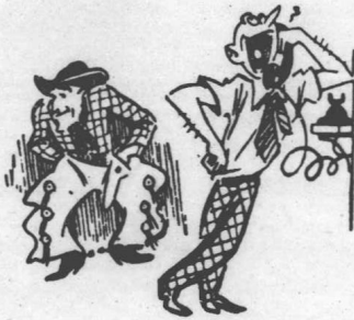
衣服漫畫化的畫法