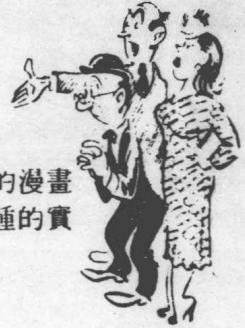
各種境遇的人物的漫畫化的畫法有100種的實例