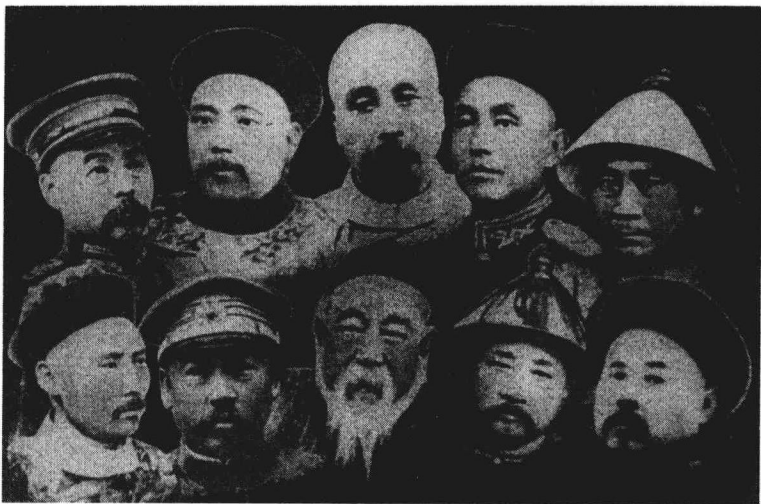
北洋军阀头目：上排自左至右：冯国璋、袁世凯、徐世昌、段芝贵、张勋；下排自左至右：段祺瑞、曹錕、姜桂题、张怀芝、倪嗣冲。