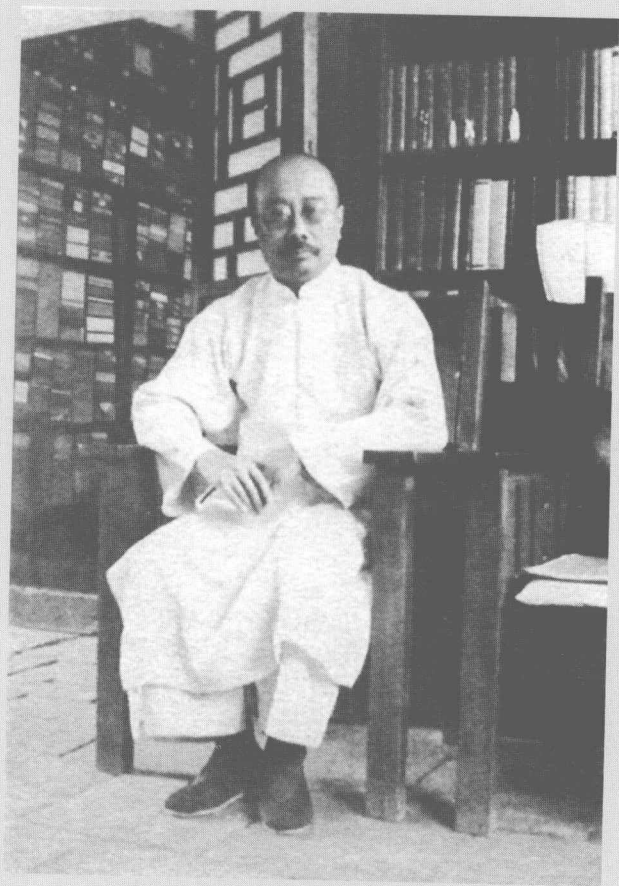
● 一九四零年攝于苦雨齋中