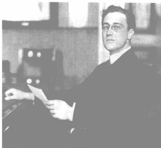
▲ 担任纽约州参议员的罗斯福