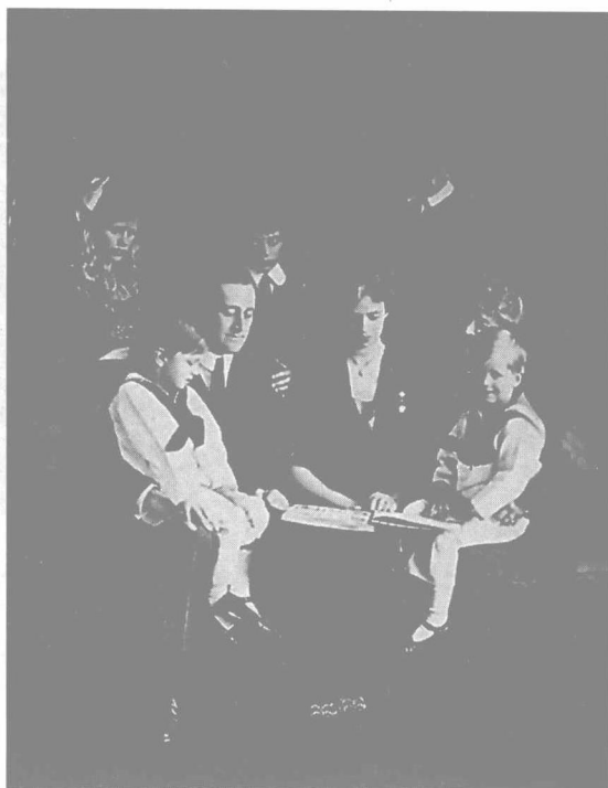
▶ 罗斯福同家人在一起