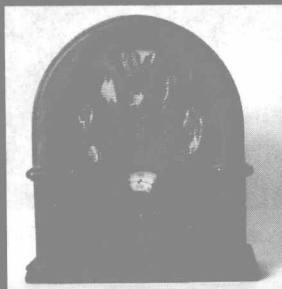
Franklin D Roosevelt

Radio Addresses to the American People 1933-1944