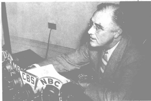
罗斯福在发表炉边谈话