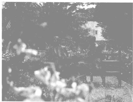
▲ 罗斯福与夫人埃莉诺塑像