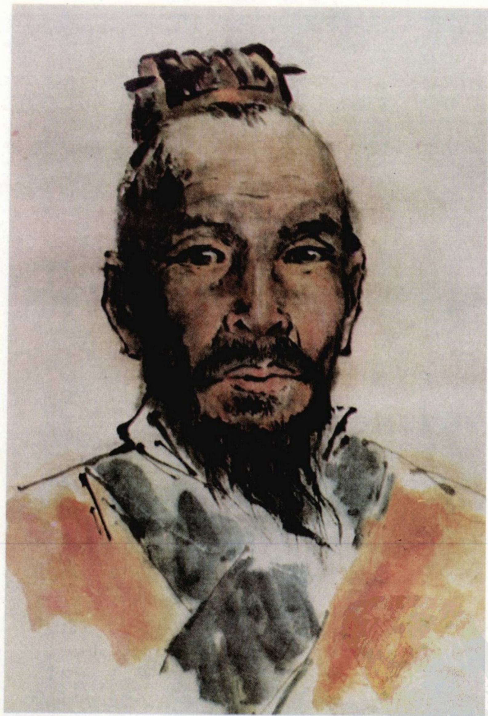
陈氏始祖 陈胡公满