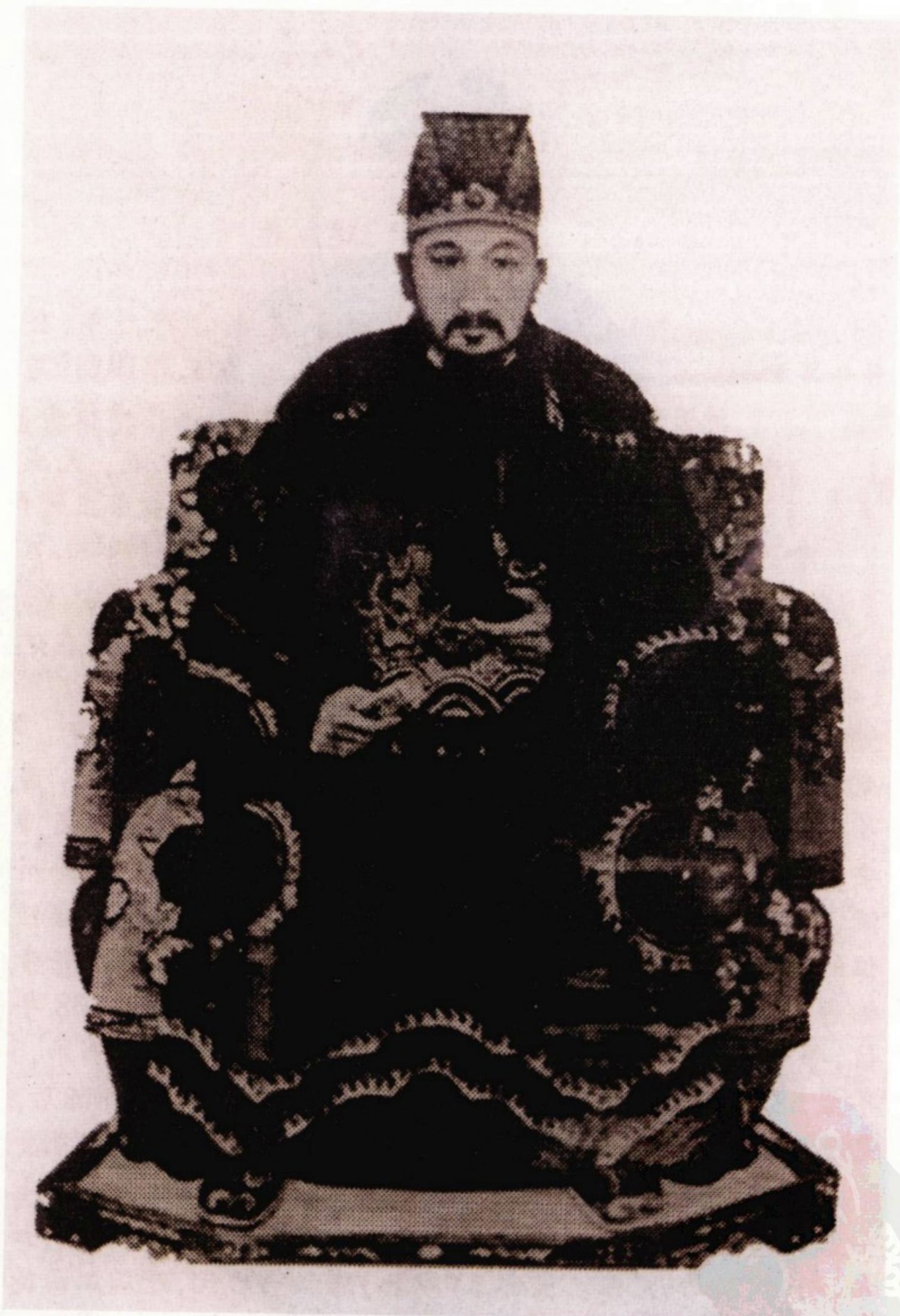
陈朝武皇帝 陈霸先