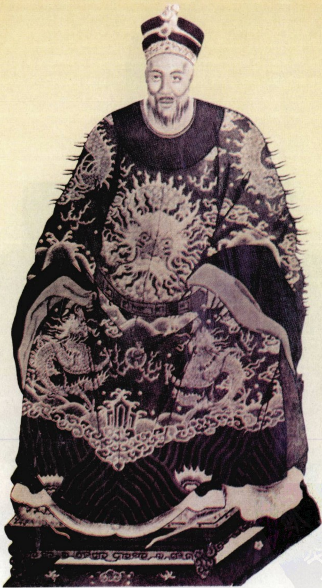
颍川始祖 汉太丘长陈实