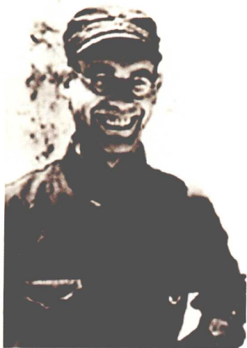
红军军事顾问—— 李德

李德于1900年9月18日生于德国慕尼黑郊区的伊斯玛宁。19岁那年，他参加了保卫巴伐利亚苏维埃共和国的战斗，29天的街垒战中，他手持毛瑟枪，指挥工人弟