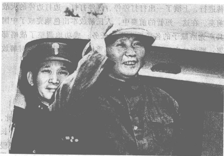
1945年8月28日，毛泽东抵达重庆，准备与国民党进行和平谈判。

1. 向北发展，向南防御 抗日战争胜利后的战略形势是：国民党军在日伪军的接应下，以“受降”为名，将大量兵力迅速从其盘踞的西南、西北地区调往华东、华北、东北地区，抢占大城市和交通要