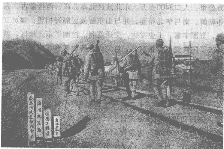
晋察冀军区部队沿铁路北上。

道，相继进占了徐州、开封、郑州、洛阳、太原、归绥（今呼和浩特）等战略要地，从而使长江以南的各解放区以及鄂西、中原等解放区陷入国民党军的重兵包围之中，有被各个击破的危险。而晋冀鲁豫、山东、华中、陕甘宁、晋绥、晋察冀等解放区也面临着国民党军重兵进攻的严重威胁。但是，东北和热河（今分属内蒙古、辽宁、河北）地区则是国民党军势力薄弱的地区，而且在短时期内也无法大批到达。特别是在东北地区，苏联红军只占有大中城市和主要交通线，而在抗日战争大反攻中迅速出关的八路军与东北抗日联军一起控制了大片地区，其他地区则为伪满军警和土匪武装所控制，人民军队争取和控制东北占有先机之利。尤为重要的是，东北地区具有十分优越的地理条件和重要的战略价值。当时所称的东北地区包括今天的辽宁、吉林、黑龙江三省以及内蒙古自治区东部和河北省东北部，面积100多万平