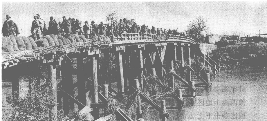
新四军第3师在进军东北的途中。

投降的日伪军，摧毁伪满政权，发动群众，建立基层民主政权；另一方面大力扩军，先后编成21个师（旅），总兵力发展到27万人，并组建了锦热、辽宁、辽东、辽西、辽北、吉林、松江、三江、嫩江、北安等10个军区，为创建东北根据地打下了坚实的基础。为了加强对东北地区各项工作的领导，1945年9月中旬，中共中央决定成立以彭真为书记，陈云、程子华、伍修权、林枫为委员的中共中央东北局。1945年10月底，东北人民自治军成立，林彪任总司令，彭真任第一政治委员，罗荣桓任第二政治委员。东北人民自治军由所有进入东北的八路军和新四军及由东北抗日联军扩建的东北人民自卫军统一组成。1946年1月，东北人民自治军改称东北民主联军。为了配合“向北发展”的任务，八路军和新四军收缩了南方战线。从1945年9月下旬开始，长江以南各解放区的人民军队开始撤离根据地。为了填补山东军区主力进军东北所留下的兵力空白，新四军主力8万余人北上山东，新四军军部兼山东军区，陈毅任司令员，饶漱石任政治委员。新四军苏浙军区主力向北转移到苏皖边区，与当地人民武装组成华