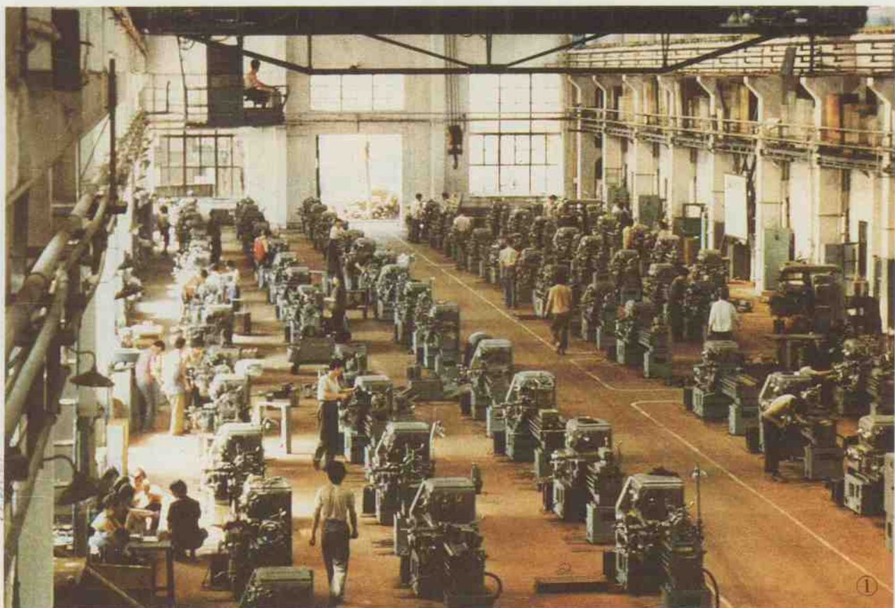
1. “40” 车间产品装配