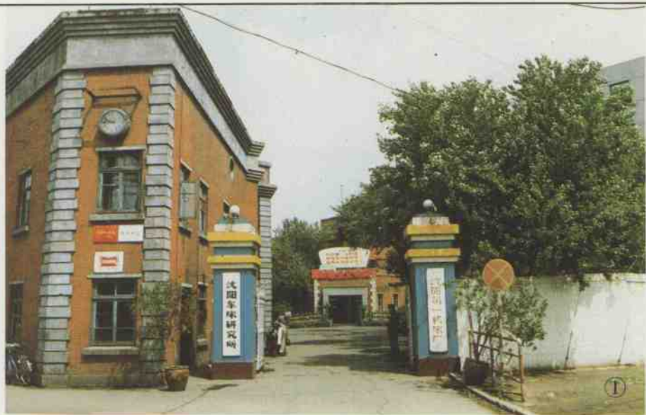
1.工厂正门 2.3.4.厂区小景