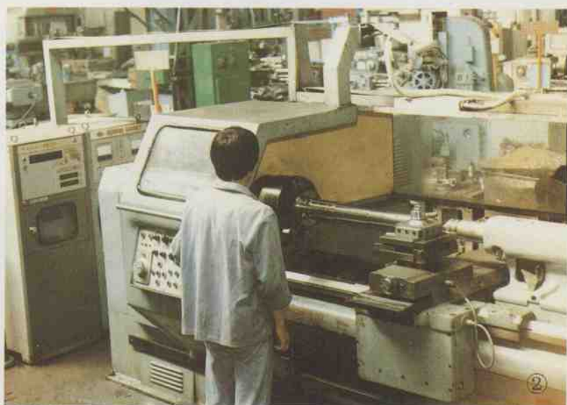
2. “40” 车间产品加工