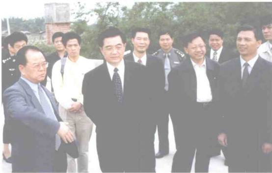
2002年3月30日，中共中央政治局常委、国家副主席胡锦涛在那良镇考察

那良成圩于1644年，至今已有360多年历史，在过去没有公路相通的年代，主要靠那良江、北仑河水路和大勉、那旺、白赖隘路与东兴、上思等进行贸易往来。街上居民多为客家移民，在此处定居后，祖祖辈辈在小圩繁衍生息，代代相传。那良圩街也由小变大，由窄变宽。特别是经过陈济棠主粤时期的二十世纪二三十年代和新中国成立后至改革开放这两个里程碑时代的发展，旧圩街道由宽约2米，只能通过两架木轿的狭小圩街变化为可通现代化交通工具汽车的宽敞街道。