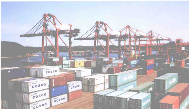
今非昔比的防城港码头