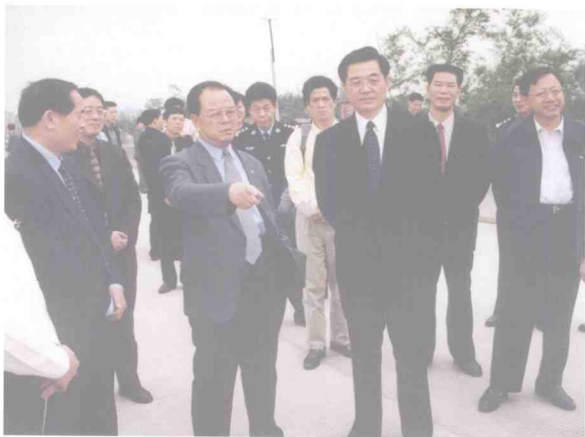
2002年3月30日，中共中央政治局常委、国家副主席胡锦涛在里接大桥建设工地考察