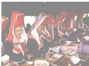
“凉棚宴”是那良镇大板瑶族特有的民族风情之一，现已成为那良镇旅游业一道亮丽的风景线。

炒粉店等。东西走向的横街和以后建成的解放路有“全记妈”、“桥养”等粉店和各式苏杭布匹店、新衣店、杂货店、茶楼等，颇有盛名，直到担水街十字路口都是商业旺地。