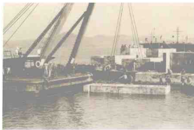
当年建设0号码头的场面

战争时期固然需要港口，和平时期更需要港口。独特的地理位置，优越的自然条件，注定了渔