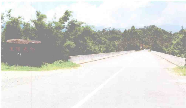
建成后的里接大桥处于翠竹环抱之中