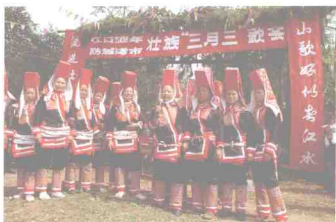
改革开放后富裕起来的那良镇，年年举办边境“三月三歌会”。图为当地大板瑶族妇女身着民族盛装在歌会上一展风采。