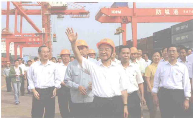
2008年10月5日，国务院总理温家宝考察防城港

势非常严峻，战火就在我国南大门燃烧着。为了更好地支援越南人民抗美援朝的斗争和出于战略的需要，中共中央和国务院决定在广西建设一个战备港口。毛泽东主席、周恩来总理在深思熟虑之后，于1968年3月22日批准了在中国广西边境海岸线上的防城建设战备港口，作为隐蔽的海上运输线，为越南人民抗美援朝战争运送物资，内定名为“广西3·22工程”。后来，“广西3·22工程”这条运输线也因此被越南人民亲切地称为“海上胡志明小道”。