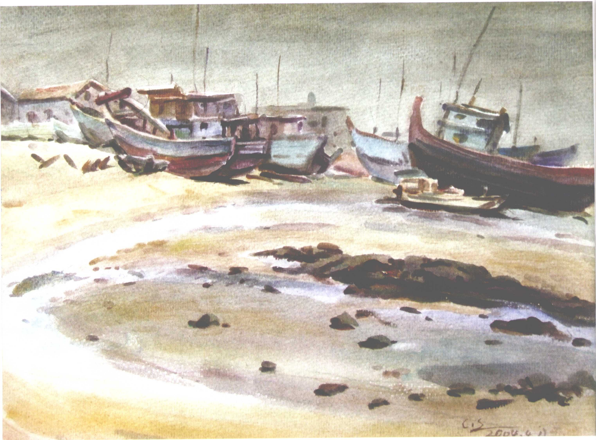
小岬风光之一（速写） 270mm × 370mm 2004年