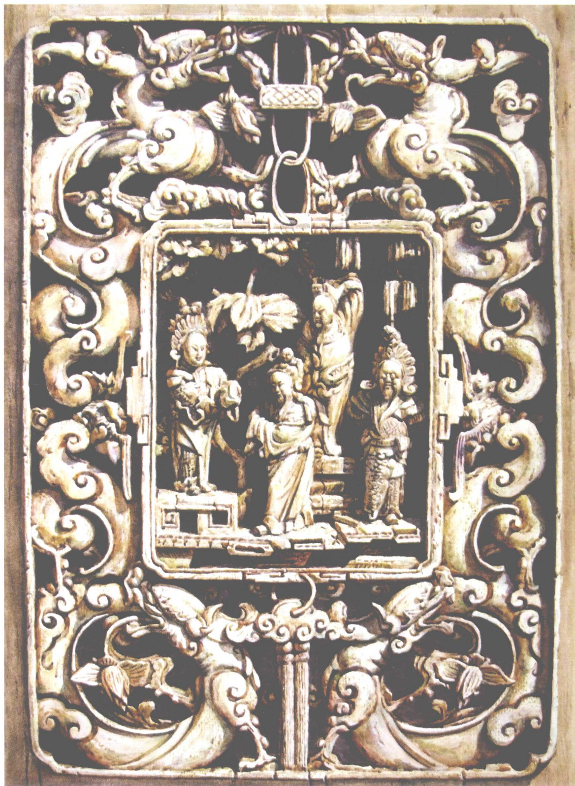
吉祥 370mm × 520mm 2003年