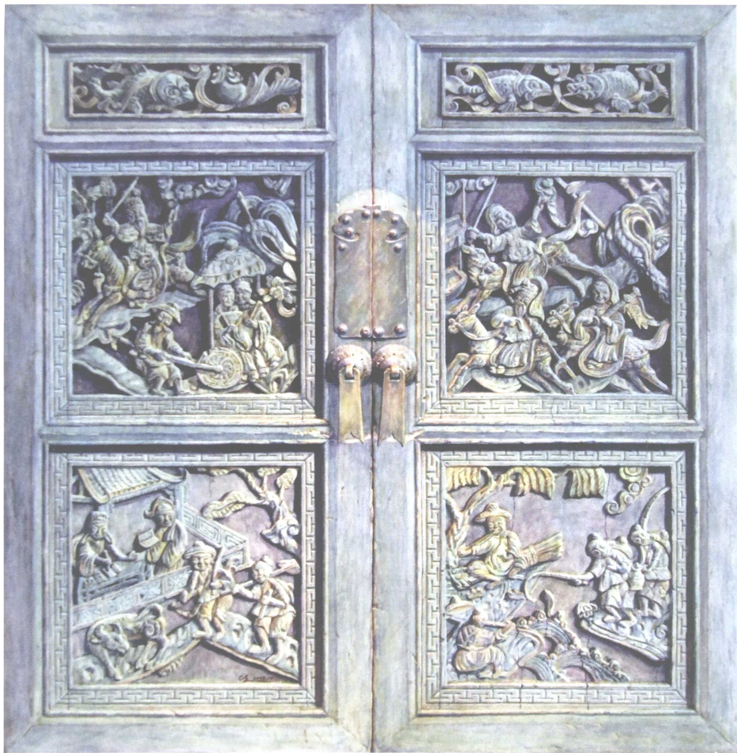
尘封的记忆 790mm × 820mm 2004年