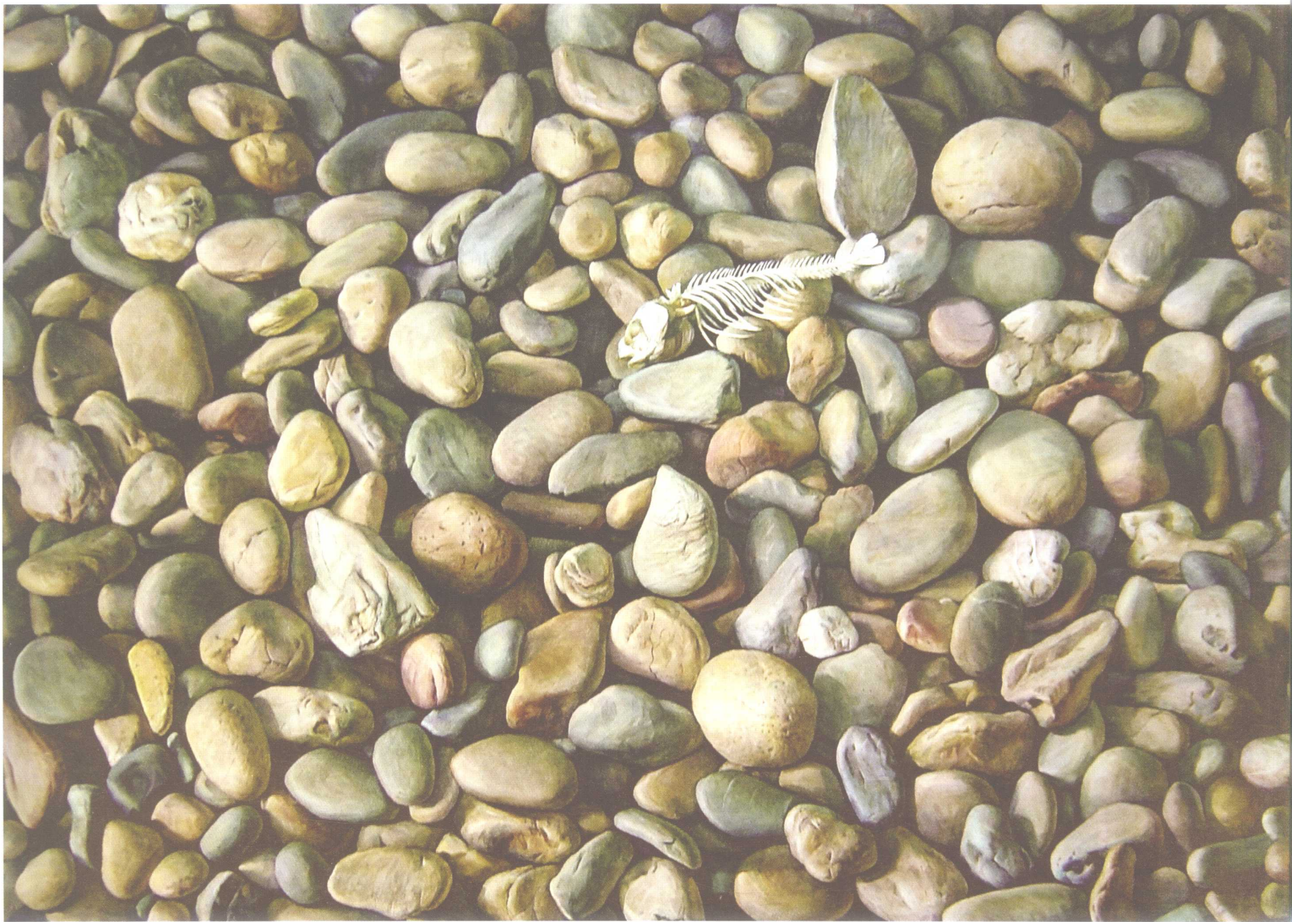
干涸的河 780mm × 1080mm 1994年