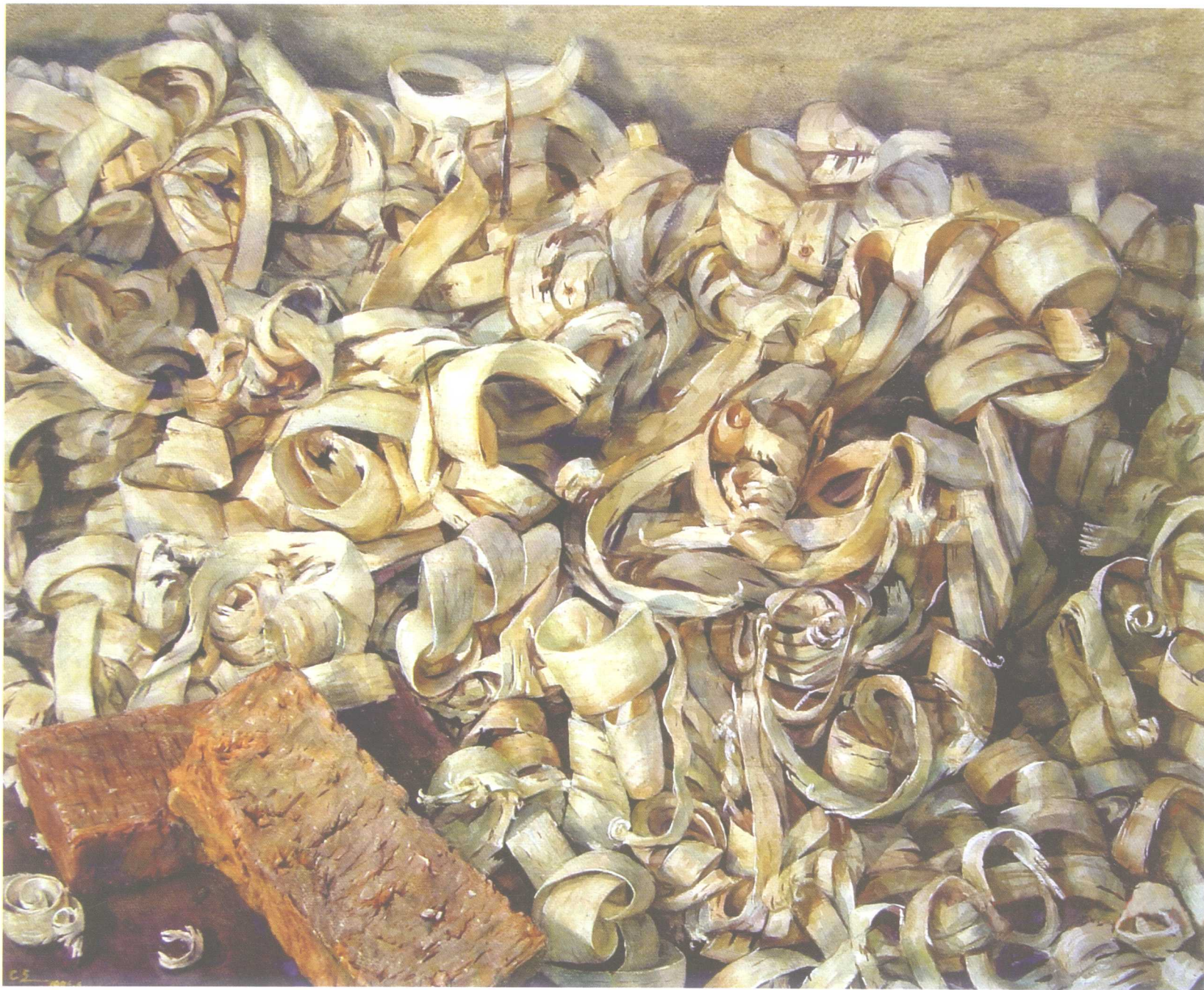
刨木花 540mm × 670mm 1996年