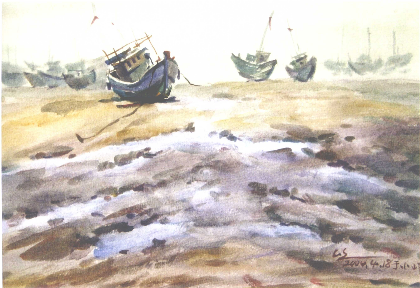
潮退了 (速写) 270mm × 370mm 2004年