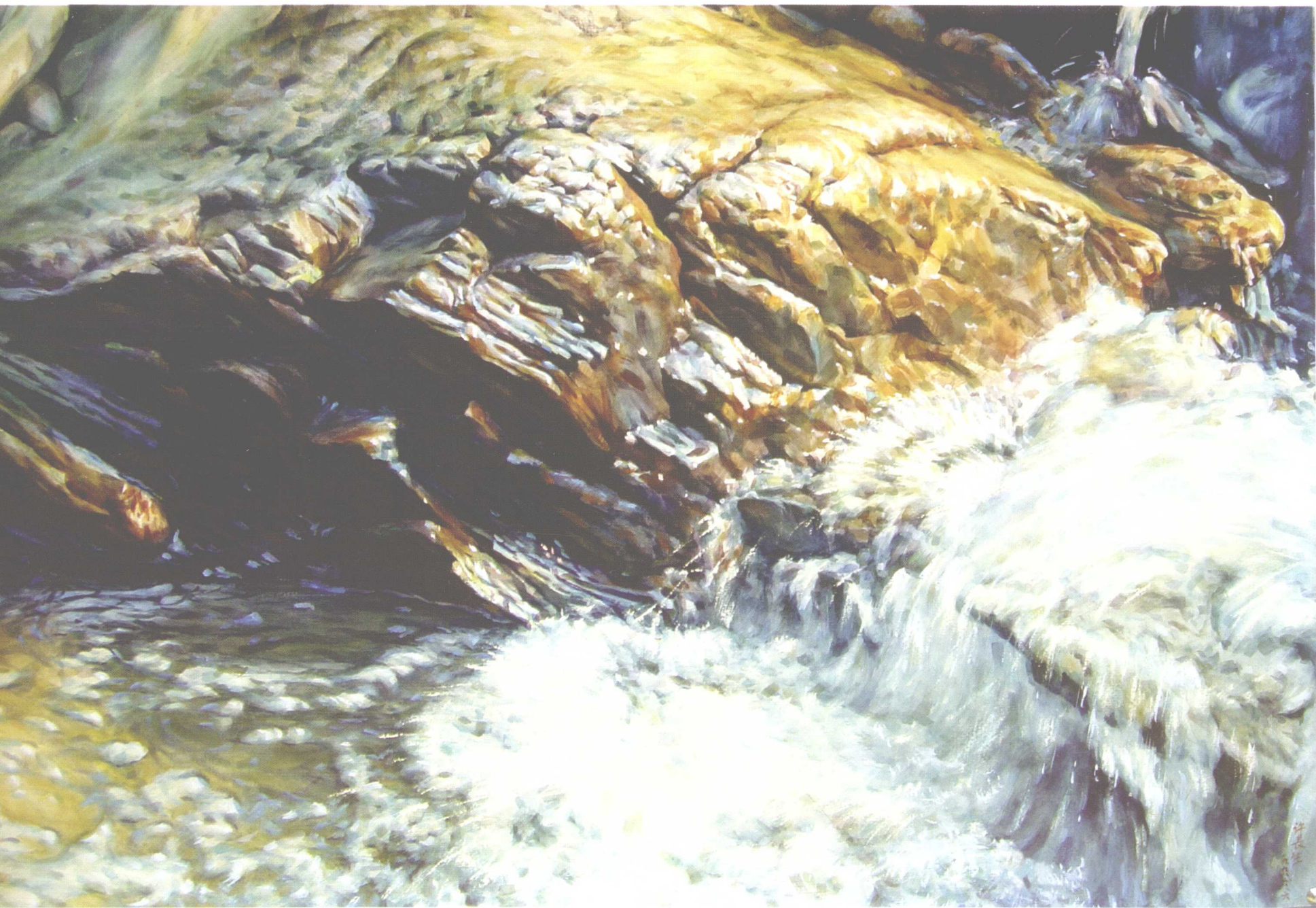
晨曲 600mm × 880mm 1998年