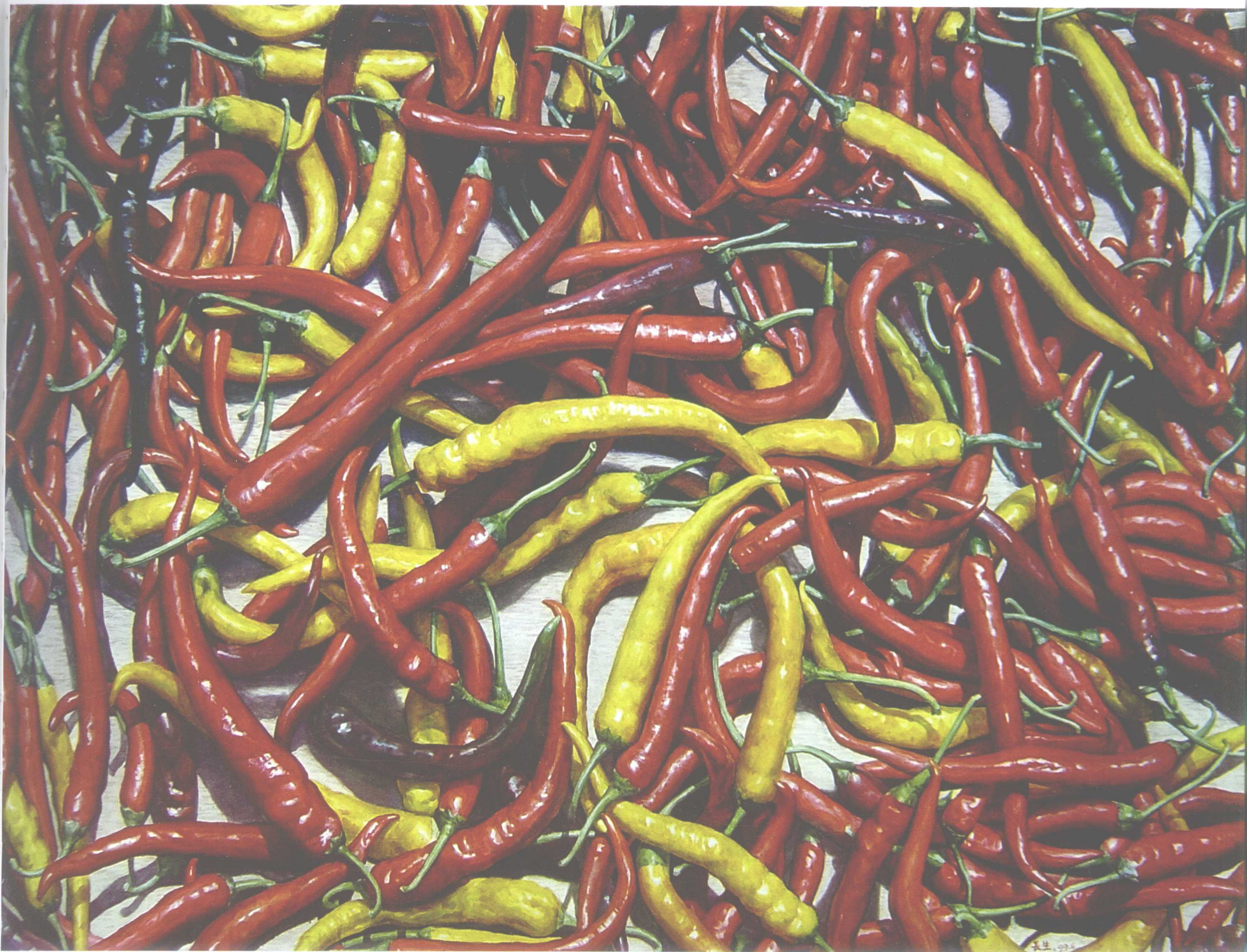
秋实 770mm × 1060mm 1999年