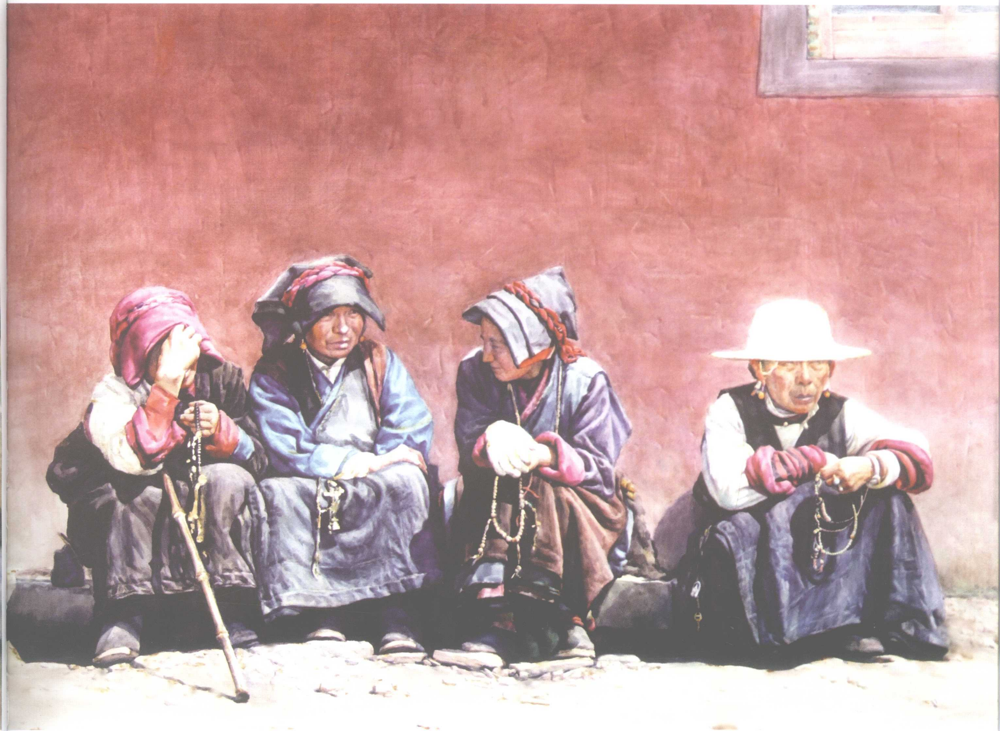
暖冬 760mm × 1060mm 2004年