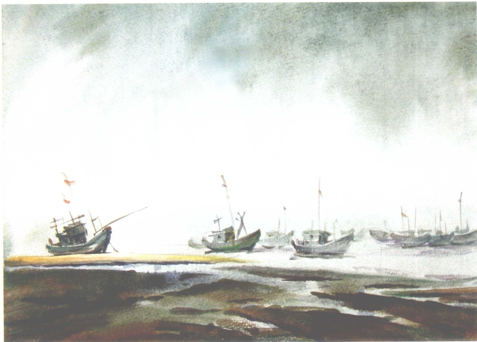
小岙风光之二 (速写) 270mm × 370mm 2004年