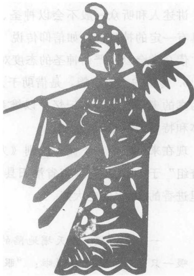
孟姜女（剪纸）。

孟姜女死不甘心，要看看秦始皇的下场。她的身体变成了一条条的银鱼。据说，现在太湖里的银鱼就是这样来的。 ①