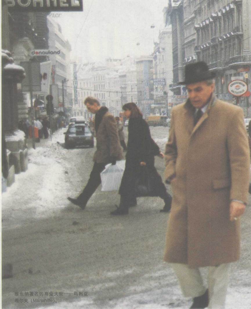
维也纳著名的商业大街——玛利亚 希尔夫 (Mariahilfe)。