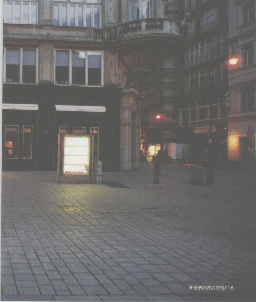
维也纳内城名店街广场。