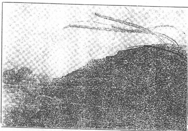
墓 在 城 西 三 里