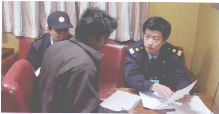
执法人员在外轮进行海事调查