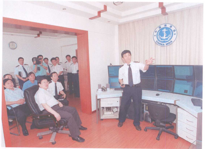
2006年8月29日，天津市委副书记、常务副市长黄兴国到天津海事局调研