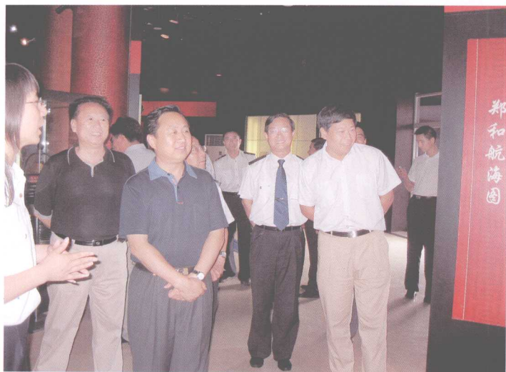
2006年8月5日，交通部副部长黄先耀参观中国航标展馆