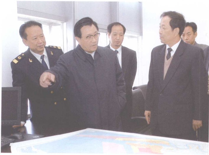
2006年4月19日，交通部部长李盛霖视察天津海事局