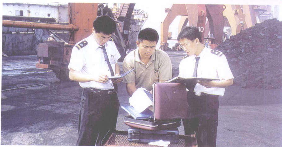
开辟“绿色”通道，保障电煤运输