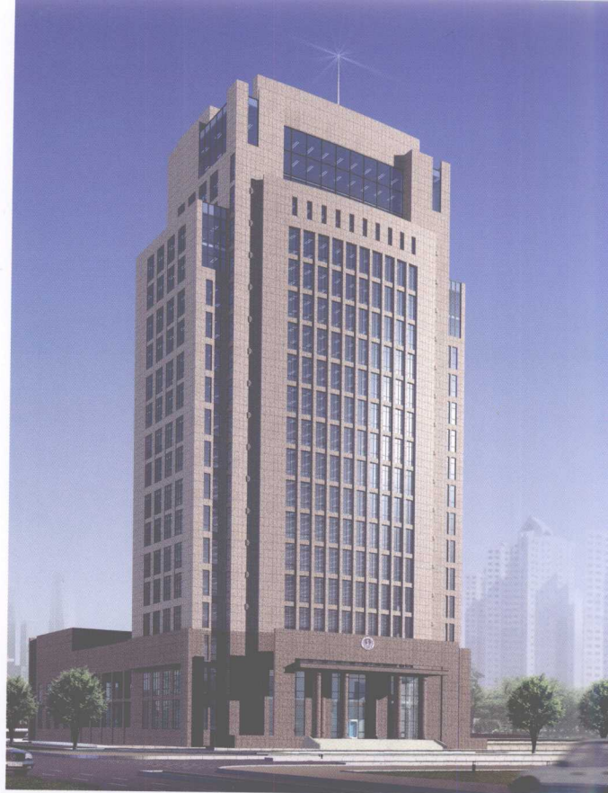
天津海事局综合办公楼