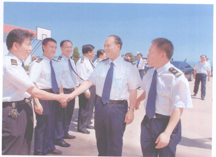
2006年11月8日，交通部副部长徐祖远慰问天津海事局一线干部职工