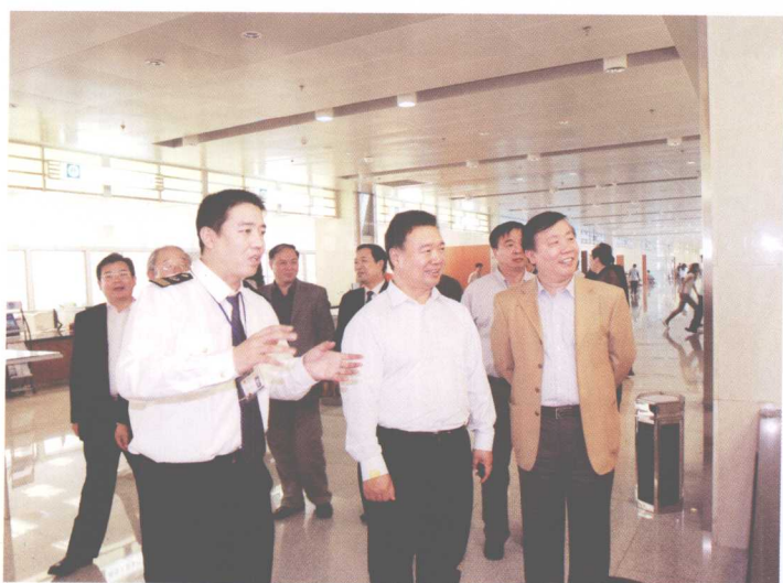
2008年4月29日，交通部海事局常务副局长刘臣到天津海事局政务中心检查工作