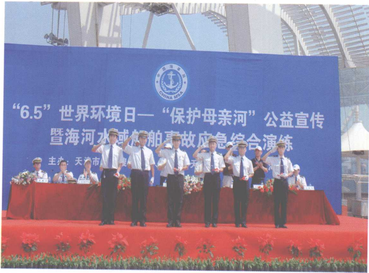
天津海事局宣传“6·5”环境日