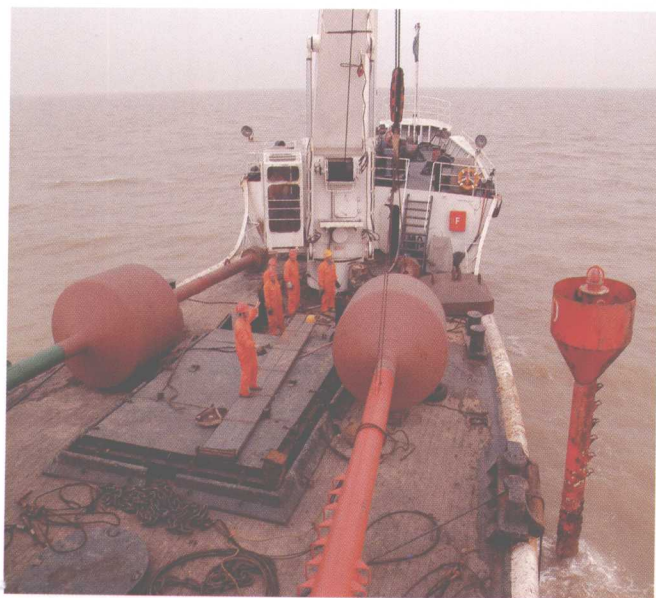
大型航标船海上航标抛设作业