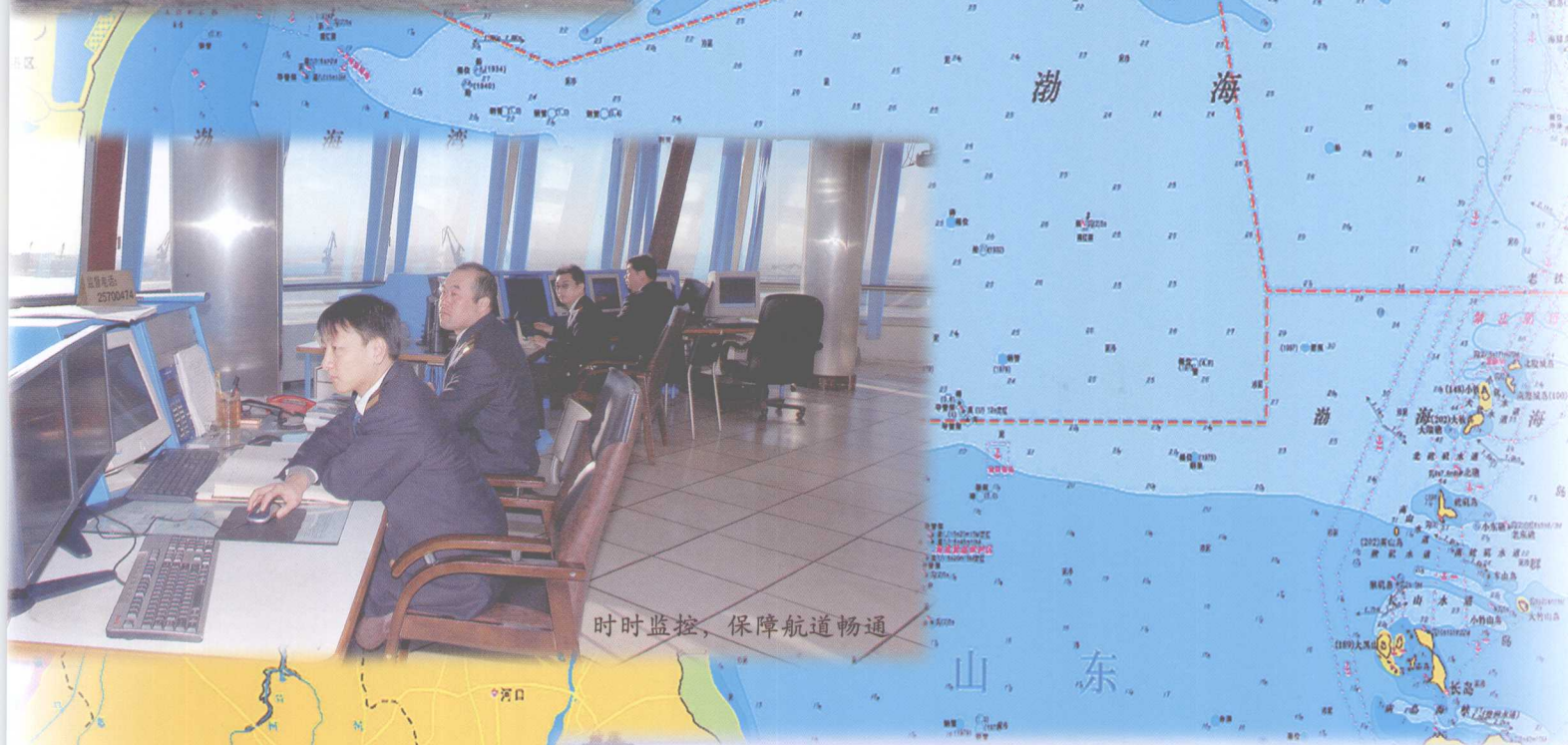
时时监控，保障航道畅通