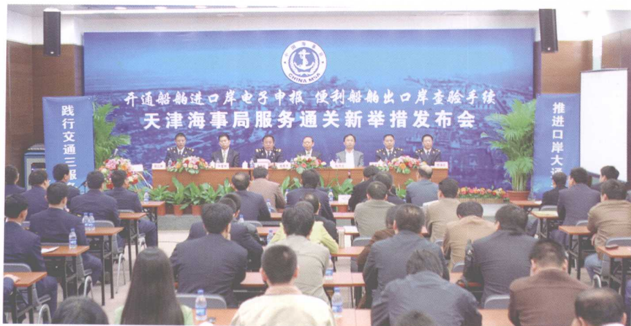
服务通关，支持滨海新区建设