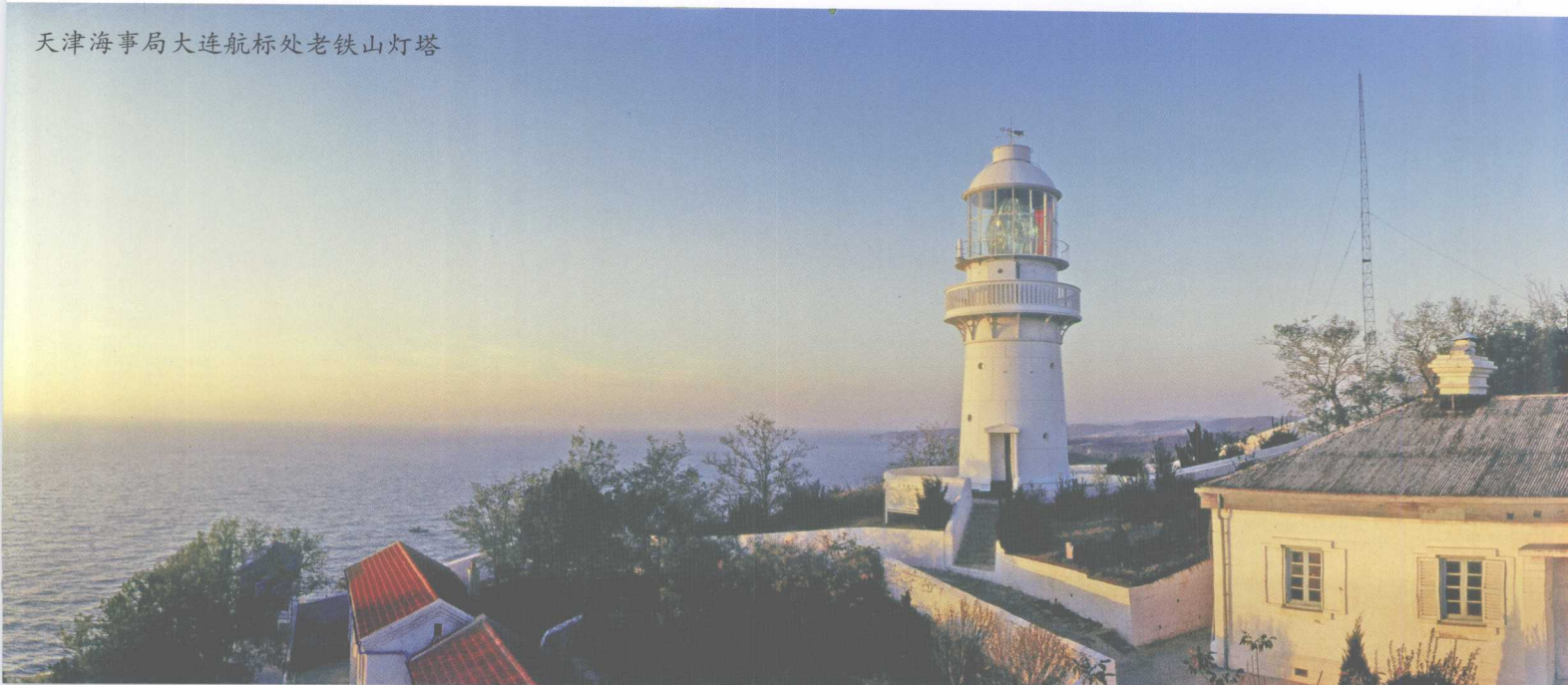
天津海事局大连航标处老铁山灯塔