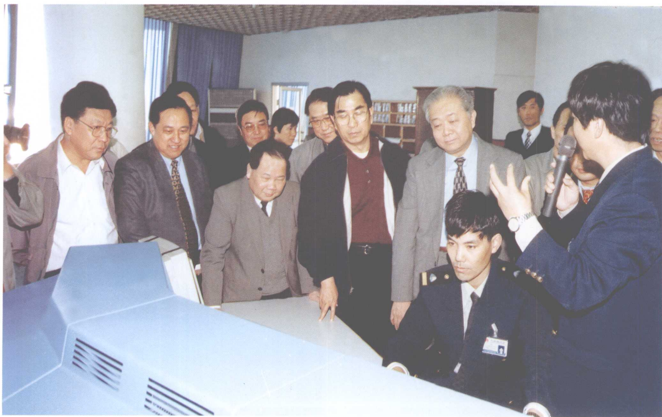
1999年10月20日，国家经济贸易委员会主任盛华仁视察天津海事局交管中心