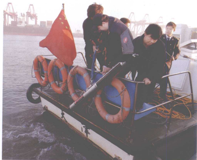
对沉船等障碍物扫测定位