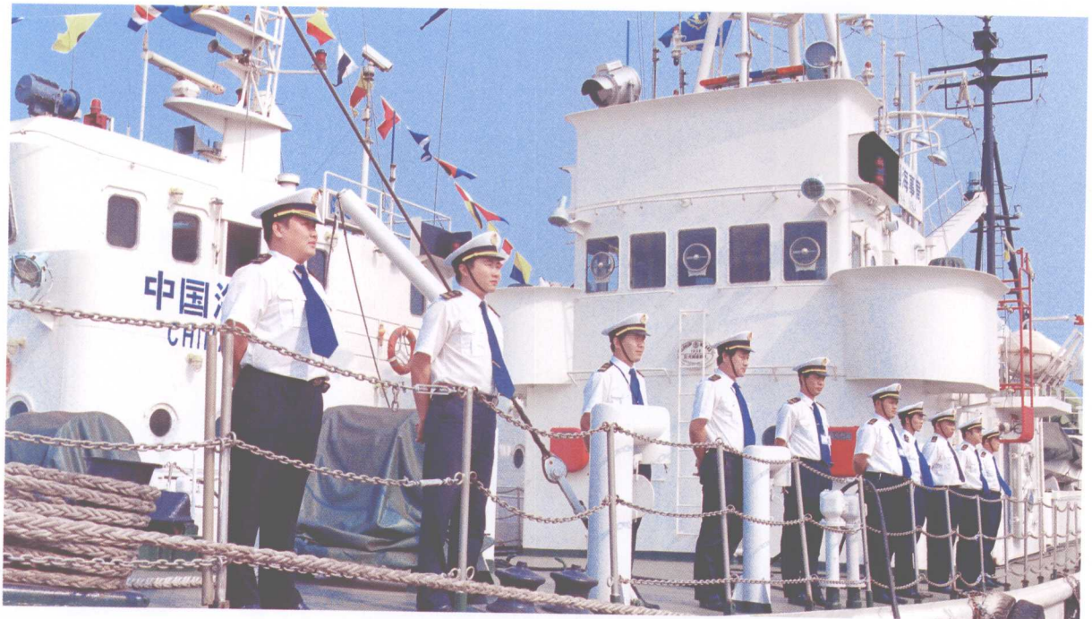
意气风发的天津海事执法队伍