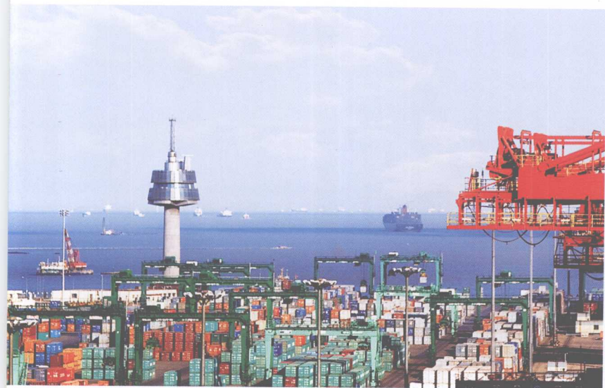
天津港交管中心塔楼