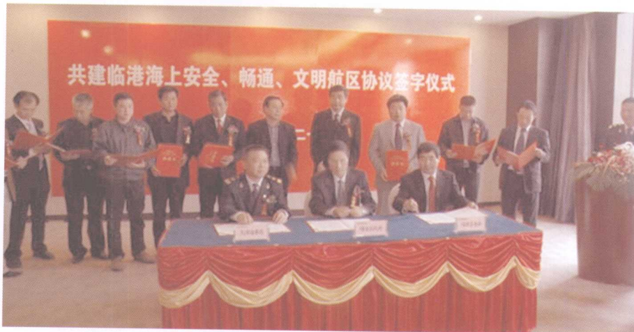
共建安全畅通文明航区