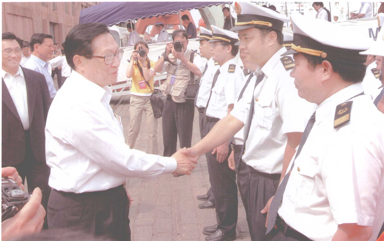
2006年6月22日，国务委员兼国务院秘书长华建敏慰问参加海上搜救演习的天津海事局执法人员