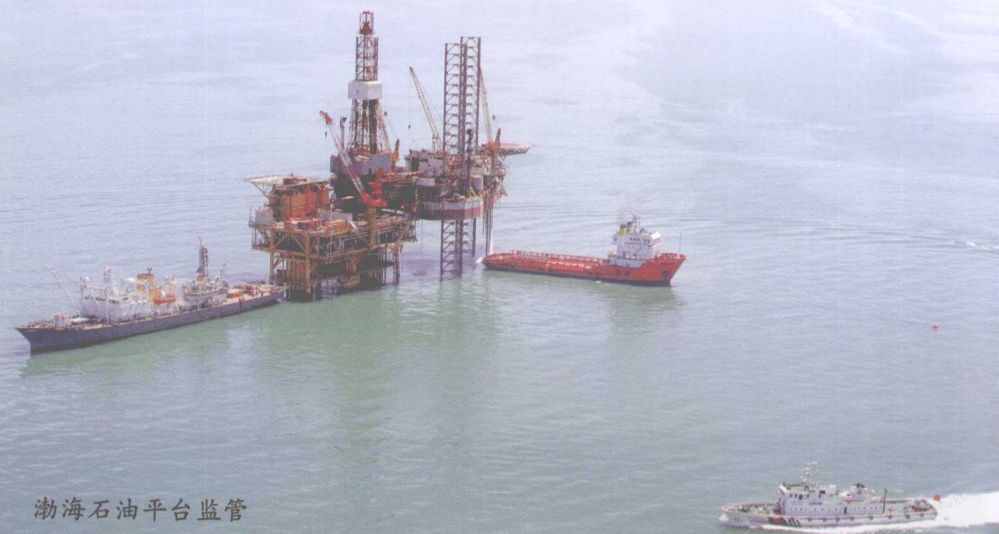
渤海石油平台监管