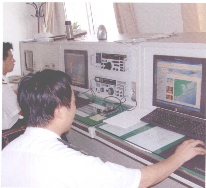
及时准确播发海上安全信息