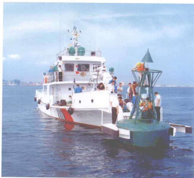
新研制的航标夹持船