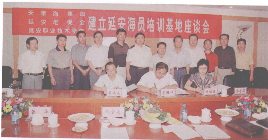
建立海员培训基地，推动中西部地区海员发展