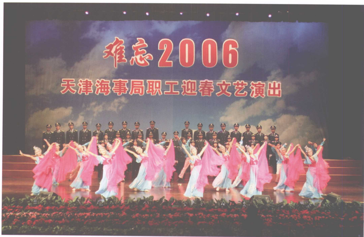
迎新春职工文艺汇演