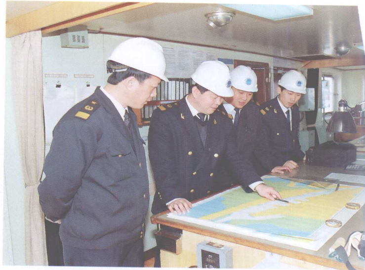
港口国监督检查员实船学习