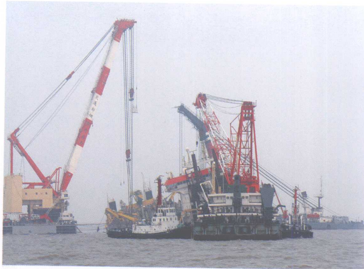
对“奋威”轮实施起浮救助