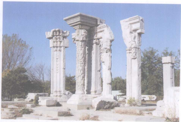
▲ 图导论-2 圆明园遗址

中国艺术设计史的研究，正是在经历了西学东渐的诸多回合的演义之后，寻找中国文化的底蕴而生发的一种复古鼎新的思路，试图建立对中国传统文明的重新认识。同时，也是对现代设计中模糊的地域特征和民族文化这一现象的一种拨正。以往设计学科的现代特性，是以西方现代文化为基础的，缺乏中国传统的民族文化特征。实际上，现代设计所指的仅仅是“现代时期”的设计，而“设计”的存在，是人类亘古以来的自然现象。