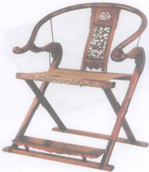
▲ 图导论-5 交椅

中国艺术设计史建立在物化和文化的双重发展的价值中，一方面，器具的发明、研制、设计，构成了物化意义的丰富性；另一方面，器具影响了人们的精神和生活，形成了社会潜质文化的特征。因此，艺术设计史是人类文明的必然产物，即通过器物的演变推动文明的繁衍，并由此构成了艺术设计学的文化基础，而艺术设计史正是从边缘发生到中心综合演变的一门重要学科。