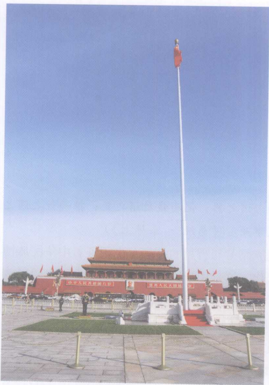
▲ 图导论-1 天安门广场

现代设计文化在中国社会的确立，需要有良性的社会条件和坚实的基础。中华民族近百年的耻辱史，也是中华民族抗争和重建家园的奋斗史。在一个多世纪的时间里，文化抗争几乎耗尽了中国人代人的心血。现在，随着欧洲文化渐渐被美国文化所替代的西方主流意识，又对中国当代社会产生着新一轮影响。幸运的是，中国在 20 世纪末期以自身的努力，终于步入了当代国际的经济文化秩序中。中国艺术设计学科正是在这个复杂的特殊背景中重新确立并逐步完善的。