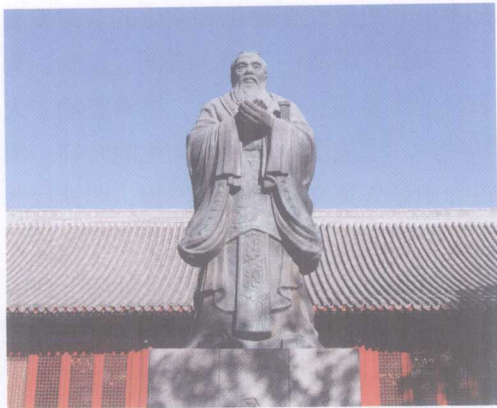
▲ 图导论 -3 孔子像