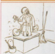
TRUTH RISING FROM HER WELL Anti-Zola cartoon by Caran d'Ache