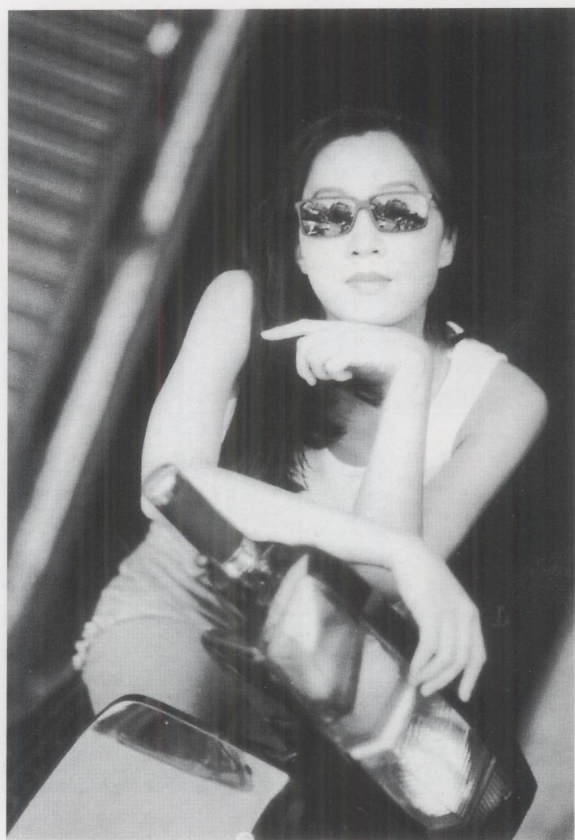
在中兴大学的小屯