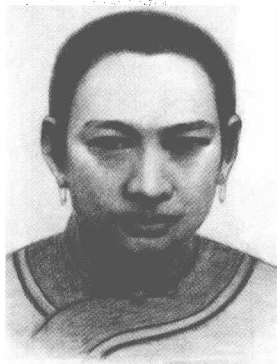
伯伯生母万冬儿画像。

“哎，你爷爷为人忠厚老实，在外工作多年，一个月最多挣过三十块钱，只够他在外面自己生活，但凡有一点可能，他也早把我们哥仨接出老家了。你伯伯写信给他，只会给他添烦心事，于事无补啊！而你四爷爷没有孩子，多年在外，经常接济家里，所以，家里有点难处，