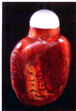
图1-6 清早期玛瑙虎头鼻烟壶 71×54.5×26.5mm 品质：工艺精 壁薄 市场中间价 估算约人民币：0.4万元