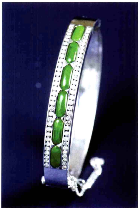
图1-4 18K金镶翡翠钻石手镯 金重: 28.8g 翡翠: 10×4×3×5mm 钻石: 1.52ct 品质: 马鞍型 色黄杨绿 芙蓉种 市场中间价估算约人民币: 2.89万元