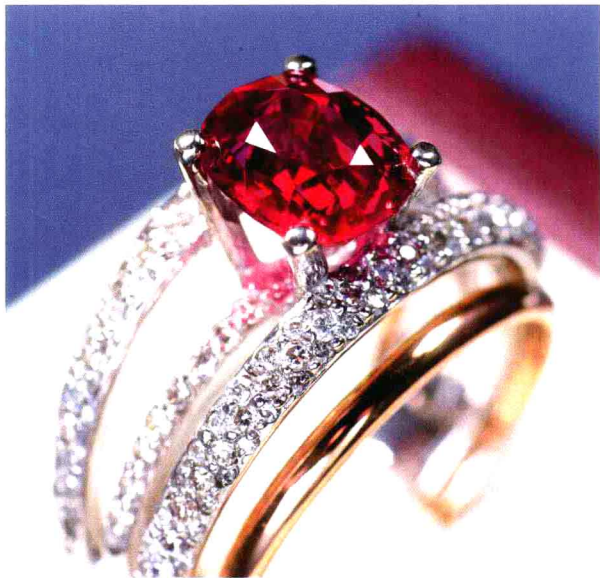
图1-3 18K金镶红宝钻石戒指 金重8.6g 红宝：2.3ct 钻石 0.705ct 品质：椭圆刻面 色玫瑰红 净度VS 切工优 市场中间价估算约人民币：7.38万元

3、珠宝首饰在价格鉴定时采用的市场比较法或专家咨询法，所选择的市场和聘请的专家有局限性，人们总是把珠宝商人作为价格鉴定人选。大部分珠宝商人虽有买卖的实际经验，然而他们经营的某一类珠宝首饰并不意味着他适合这类珠宝的价格鉴定（如：未经过珠宝鉴定培训的珠宝商人可能误定珠宝，形成错误的鉴定结论；再者，珠宝商人往往以自家商场的珠宝价格去衡量被鉴定的珠宝首饰的价格，缺乏市场价格的综合性；