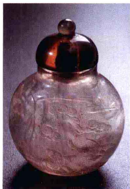
图1-5 清早期水晶山水鼻烟壶 77×55×45mm 品质：工艺精良 壁薄 市场中间价 估算约人民币：1.8万元

另外，1995年人事部及国资委发布的《注册资产评估师执业资格制度暂行办法》、1999年人事部和发改委印发的《价格鉴证师执业资格制度暂行规定》和《价格鉴证师执业资格考试实施办法》及《注册珠宝评估师》等。各部门制定的市场规范准则、定级标准、资格认定等为价格鉴定机构提供了行业规范支撑依据。对用价值的高低来度量珠宝首饰的品质、质量、等级、档次的办法具有广泛的指导意义和技术基础。