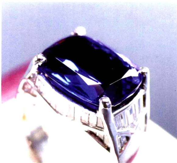
图1-1 铂金镶坦桑石钻石男戒 金重20g 坦桑石：14.77ct 钻2.54ct 品质：刻面型 色浅紫蓝 净度：VVS 切工优 市场中间价估算约人民币：20.68万元

一谈到珠宝首饰，似乎无人不知、无人不晓，而且人见人爱。这是由于它们独特的魅力——集美丽、财富、社会地位和人的艺术修养为一身的特殊产品。但人们似乎又觉得珠宝首饰深不可测，珠宝首饰的价格如何确定？怎样鉴定珠宝首饰的品质、质量？它们和价格之间又有何种关联？这些问题一直都困扰着人们，使珠宝首饰始终披着神秘的面纱。常言说黄金有价玉（宝）无价。玉（宝）真的无价吗？非也。黄金有价，仅仅是黄金在国际上有一个交易定价标准；珠宝、玉石（除钻石外）至今尚无准确的定价标准，但珠宝、玉石的品质和质量与价格之间始终存在着某些关联，寻找这些关联是珠宝首饰价格鉴定中首要的工作。