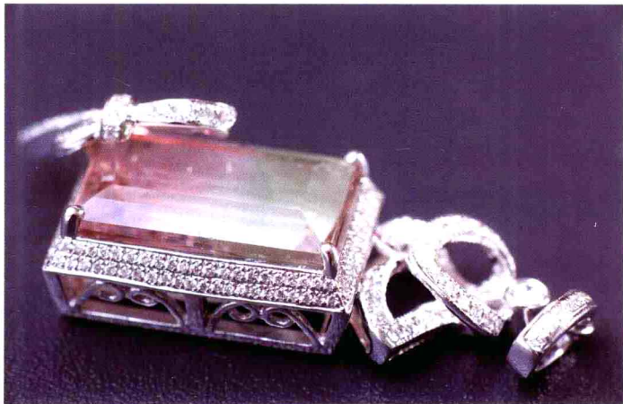
图1-2 18K金镶西瓜碧玺钻石挂坠 金重：6.24g 碧玺：10.38ct 钻石：0.56ct 品质：长方刻面 色褐、粉、绿、无色（又称西瓜碧玺） 市场中间价估算约人民币：3.65万元

我国的评估业形成于20世纪80年代末，经过改革开放，经济体制改革取得突破性进展。计划经济时代严重扭曲的价格结构，得到了全面改变：土地、矿产资源、房屋、设备等固定资产，由不计价格、无偿使用逐步进入市场，变为要计价、有偿使用、市场交易；并且引起了企业破产、合并、转让中的资产、产生的事故损坏、拍卖、清仓，包括企业的商誉、商标等无形资产，保险理赔、财产抵押等，这些都需要认定价格，从而导致了政府与市场主体之间、各类市场主体之间产生了经济类中介组织——评估机构和价格鉴定机构。这是因为在市场经济活动中，物与物的价格关系背后是人与人的利益关系，价格成为经济纠纷的焦点，同样也成为司法、行政执法机关确立办案证据的要素。我国1993年成立了中国资产评估协会，1995年5月，国家人事部和国有资产管理局联合发布了《注册资产评估师执业资格制度暂行规定及考试实施办法》；1996年国家计委印发了《价格评估管理办法》，1998年国家发展计划改革委员会关于印发《涉案物品价格鉴证人员资格管理实施细则》的通知，1999年6月以人发[1999]66号文件发出关于印发《价格鉴证师执业资格制度暂行规定》和《价格鉴证师执业资格考试实施办法》的通知，正式迈开了我国政府对评估业规范管理的步伐。特别是价格放开后，市场价格的千变万化，使行政执法机构、司法机关和纪律检查机关在办案过程中对确定各类涉案物品价格变得非常困难，从而给法院判案带来很大难度，这是因为案