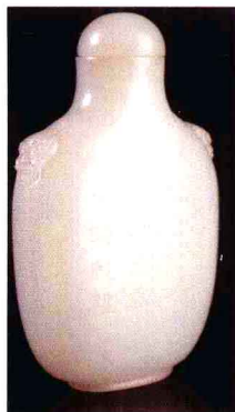
图1-8 清乾隆白玉羊得意鼻烟壶 65.8×40.5×18mm 品质：色白 质地细润 工艺精良 市场中间价 估算约人民币：6.6万元