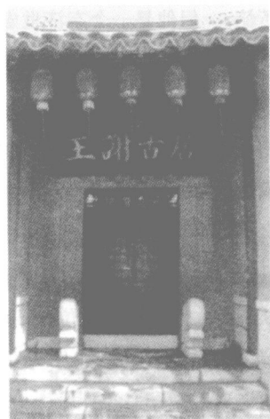
谢氏南迁后的建康旧居

在晋宋嬗代之际，王、谢等世家大族着眼于本家族的切身利益，并没有为司马氏殉葬的决心，谢家子弟分别追随刘裕、刘毅就是一个明证。谢灵运颇有建功立业的雄心壮志，刘毅失败后，他转而把济世之愿寄托在了刘裕身上。义熙十二年（416），刘裕率兵北伐后秦时，命其弟骠骑将军刘道怜留守京师，并任命谢灵运为刘道怜的咨议参军。后转中书侍郎，又担任刘裕的长子刘义符的中军咨议。可见，刘家还是看重谢家名望的。北伐大军到达彭城（今江苏徐州）时，谢灵运奉使劳军，作了长篇《撰征赋》，对刘裕歌功颂德。一年以后，刘裕生擒后秦国君姚泓而得胜回朝，驻扎于彭城。因为功业巨大，刘裕被封为宋国公、相国、加九锡，权倾朝野。义熙十四年（418）六月，刘裕在彭城项羽戏马台大摆宴席为人送行，谢瞻、谢